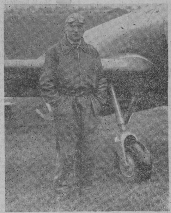
EL AVIADOR LEMOINE, MUERE POR MAL-FUNCIONAMIENTO DE SU PARACAIDAS.— Durante un vuelo de ensayo, un avión cuatrimotor tripulado por el célebre aviator Lemoine, antiguo recordman del mundo de altura, ha caído violentamente por motivos que se ignoran. El aviator Lemoine, intentó salvarse arrojándose del avión pero el paracaídas funcionó mal y el cadáver del desgraciado aviator fué recogido a 1.200 metros del aparato.

Pasando en silencio otras empresas de aquel rey, después de conquistar sus tropas toda España, en honor de Dios y del bienaventurado apóstol Santiago, se puso en marcha con di-