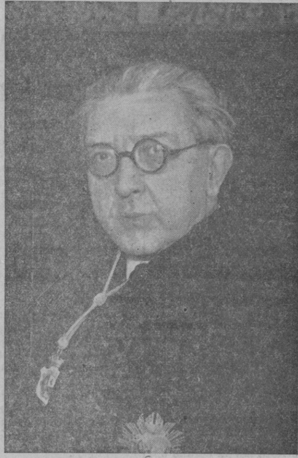
NUEVO MINISTRO.— Don José de Oriol Anguera de Sojo, ex-presidente de la Audiencia de Barcelona y ex-Fiscal de la República, cuya designación para ocupar el Ministerio del Trabajo ha sido enormemente discutida.

Estas conquistas han de afianzarse manteniendo en todo su prestigio el derecho, y el derecho político exige paz pública y el encuzamiento de las luchas por normas legales.