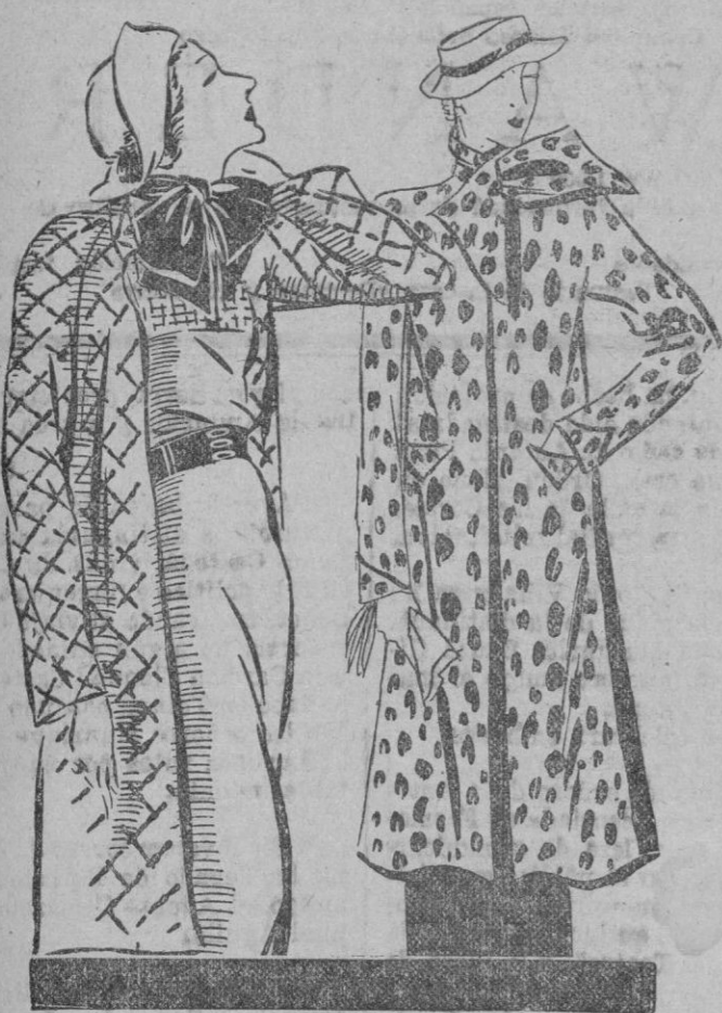
Sobre fondo gris y tres tonalidades distintas, traerán otras elegancias.

Un sentido de juventud, de perdurable lozanía, alegría la figura y evidencia el advenimiento de una fresca elegancia a los atavíos de mujer. El abrigo tres cuartos, torna rumbos de caprichosa ingenuidad e imprime desembarazados efectos de vitalidad y eficacia en este reinado infinito de la gala femenina. Los coloridos son diversos y los dibujos discurren en tributo de ideas a