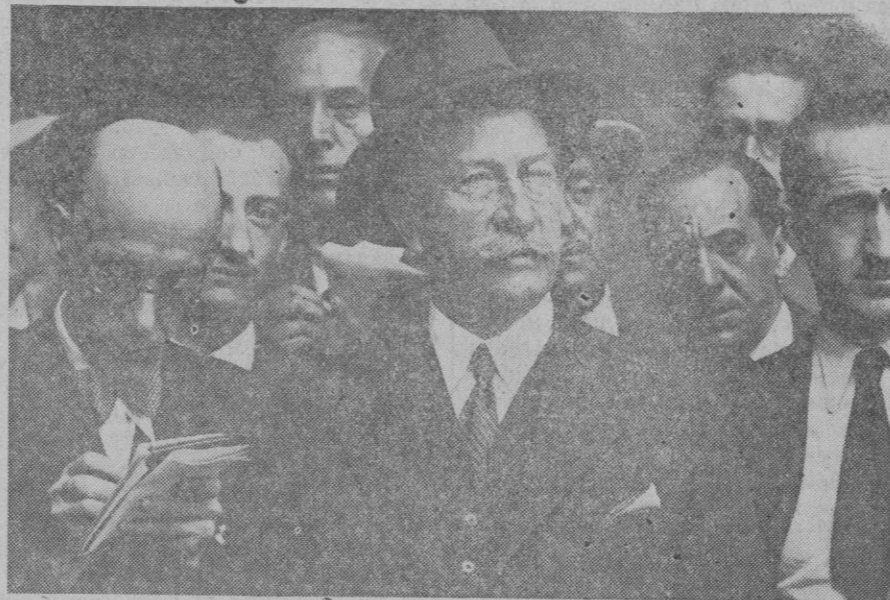
CRISIS MINISTERIAL. — D. Alejandro Lerroux, saliendo de Palacio con el encargo de formar Gobierno.