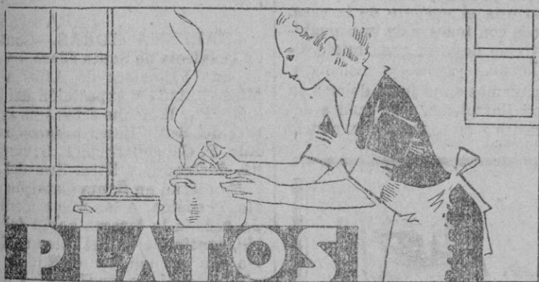
Para los asados, hay que saber preparar su jugo.

cuales más encantadoras y sugestivas. Las lanas a cuadros en colores rojo y amarillo, sobre fondo gris; violeta, amarillo y azul, sobre el mismo fondo, es decir, a dos y tres tonos. También en punto de tricot, y facultando otras generalidades, da a los abrigos tres cuartos en esta hora, un predominio y un favor sin par. Algunas de estas adorables creaciones reunimos en el grabado como testimonio gráfico y elocuente de lo que es y representa esta simpática variación en nuestras prendas de vestir.