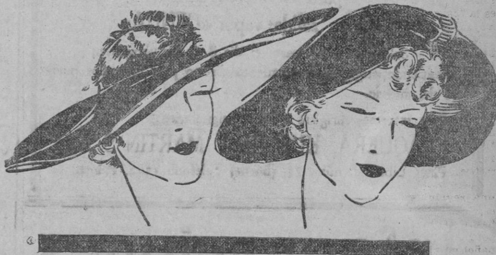
Se hacen en terciopelo negro y marrón con ancha ala.

Vuelve a los sombreros su vieja popularidad de alas anchas, que alternarán confundidos con los pequeños casquetes, furor en todo tiempo.