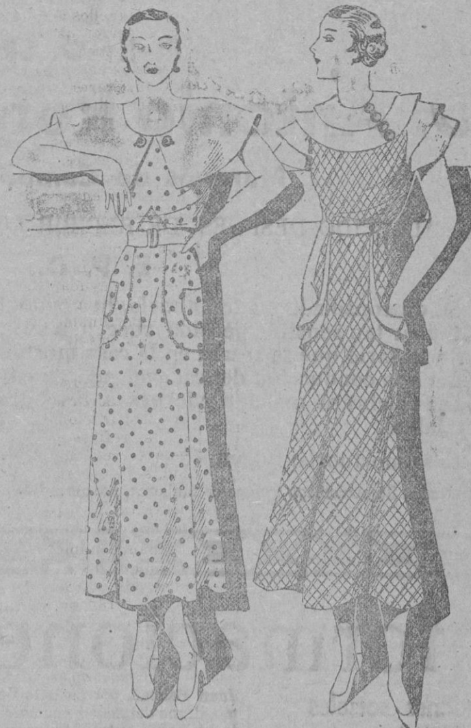
Los grandes y pequeños cuellos de piqué blancos se ajustan para armonizar sobre todos los trajes ligeros de estío.

La preferente atención que ha merecido de las damas la adaptación y uso de los grandes cuellos de piqué blanco ha servido para que su aplicación se extienda y adquiera carácter de verdadero frenesí.