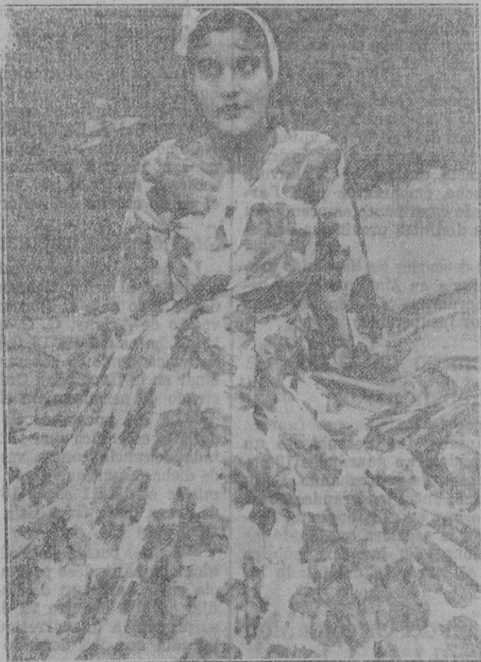
FRANCIA. — Miss Gitana Francesa 1934. — Acaba de procederse a la elección de Miss gitana. Una bella muchacha de Asnieres ha obtenido el título de Reina francesa de las gitanas.