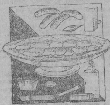
Con los albaricoques se pueden preparar, mermeladas, compotas, sopas y hasta arroz con leche de una suma originalidad.

El albaricoque es una de las frutas más apetecidas en estos meses caniculares. Servidos en la mesa en un recipiente con hielo, en un lavafrutas, por ejemplo, de cristal, se llevan a la boca constituyendo un refrescante grato y sabroso para la asfixia de nuestro estómago ante la influencia de la temperatura. No es prudente exagerar la nota de consumo ya que ello pudiera ser causa de molestias gástricas. Cuatro o cinco albaricoques, está bien, y, cumplen a maravilla el placer de refrescar nos algo.