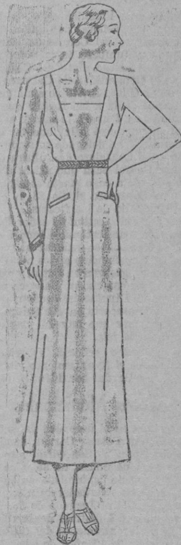
Está hecho con tela blanca y cinturón de cuero trenzado, multicolor. El plastrón se prolonga en tablero de falda. Un bias ligero bordea los bolsillos. Medidas: 2'70 en 1'20 de ancho.