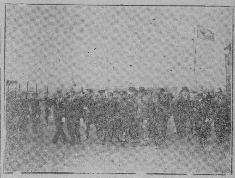
UNA ESCUADRILLA SOVIETICA LLEGA A LE BOURGET—Devolviendo la visita que les hizo el «Emergeude» una escuadrilla soviética ha llegado a Le Bourget. Los viadores rusos han sido recibidos en su aterrizaje por el antiguo ministro del aire M. Pierre Cot, que hizo el viaje a Rusia a bordo del «Emergeude». Los aviadores rusos a su llegada a Le Bourget: desfilan ante las tropas que han acudido a rendirle honores. En el mástil (a la derecha) la bandera soviética.