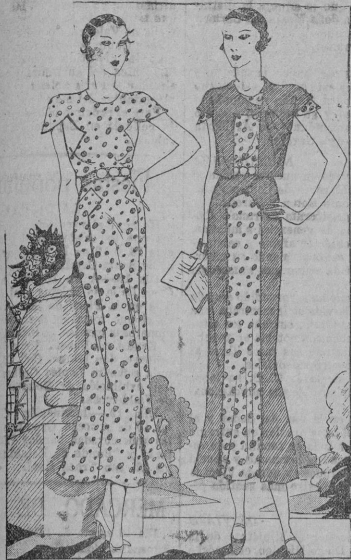
El crepé de China blanco, con estampaciones de puntos en rojo, negro y amarillo, será un tejido muy visto en la temporada.

Recogemos estas breves notas de elegancias femeninas haciendo presente la aparición de un nuevo tejido de crepé que va a tener la suerte de remontar rápidamente su popularidad y hacerse indispensable en todo vestido. Nos referimos al crepé de China blanco con estampaciones de pequeños lunares en rojo, amarillo y negro. Este primer traje que en el dibujo ofrecemos marca la nueva variación. El corpiño va abotonado en la espalda y cor-