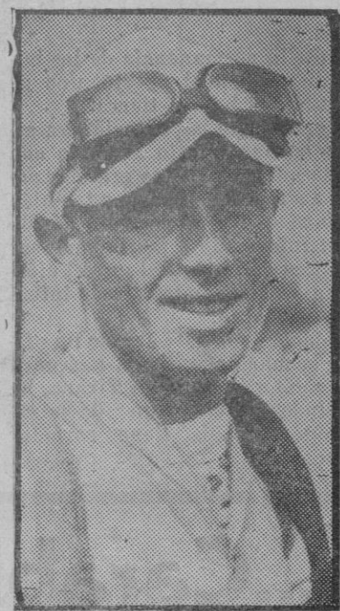
BARCELONA. — Rogora (italiano) campeón de la vuelta ciclista a Cataluña 1934

L'illustration Francaise dedicado al L'ENFANT