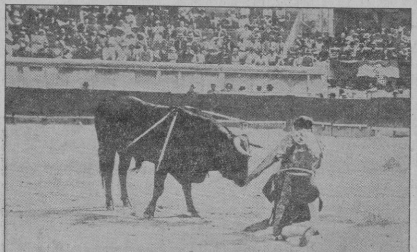
Y como en sus mejores tiempos, cuando el nombre del trianero era cartel de arrojo magnífico, Juan Belmonte se arrodilla ante el toro de su reaparición, en Nimes. Las orejas del bicho son el premio a la faena del torero

Ya está Juan vestido. Sólo espera que le anuncien la llegada del coche para colocarse la casaquilla y la montera. La tarea ha sido reposada y lenta, porque Belmonte es uno de los toreros que con más gusto se visten. La elegancia y la naturalidad de su arte la lleva a su tocado. El cuarto se va llenando de amigos y admiradores. Allí están Zuloaga, el embajador en Londres, Pérez de Ayala, y numerosos aficionados de España y Francia. Todos hablan. Comentan el retorno del maestro, Juan calla y ob-