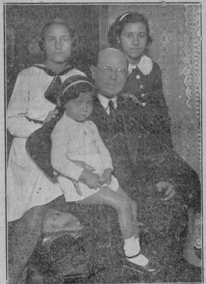
HOMENAJE A UN MUSICO DE FAMA MUNDIAL—El ilustre músico Pablo Casals, considerado actualmente como una de los primeros músicos del mundo, ha sido objeto de un merecido homenaje. Una vía de la ciudad de Barcelona ha recibido su nombre al propio tiempo que ha sido condecorado con la medalla del Mérito de la ciudad.— En nuestra fotografía, Pablo Casals, en la intimidad, con sus sobrinos

Con la libertad de importación establecida y con esta competencia del precio, la bebida mala desplaza a la buena, y el alcoholismo aumenta en circunstancias tan alarmantes que ya dos senadores, M. Borah, en nombre de los "secos", y M. Walsh, en nombre de los "húmedos", han anunciado su propósito de pedir a la Cámara el retorno puro y simple al reglamento de prohibición. Comentando este hecho se ha afirmado en varios periódicos yanquis que hay una receta bien sencilla para limitar los estragos del alcoholismo; receta probada con eficacia a través de los siglos y en todos los países, y es facilitar el uso del vino. Mientras mas vino consume una población es menor el consumo del alcohol. El Director de la "Federal Alcohol