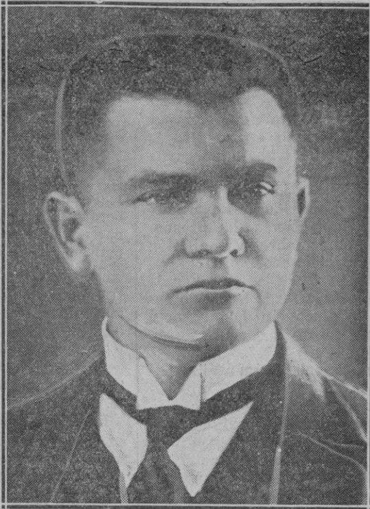
El ex-presidente del Consejo de Ministros de Lituania señor Valdemaras, que con motivo de su intento de golpe de Estado, para derribar al Gobierno, ha sido condenado a 10 años de trabajos forzados por los Tribunales del país

Ojalá esta campaña sea eficaz y se logre restablecer el precio de los trigos y las harinas a sus cotizaciones normales, evitando que una política que se inició únicamente para evitar que el trigo se cotizara a precios tan bajos que implicaran la ruina de la agricultura, haya servido para lograr una supervalorización del trigo que ha alcanzado cotizaciones tan elevadas que han causado un evidente perjuicio al consumidor.