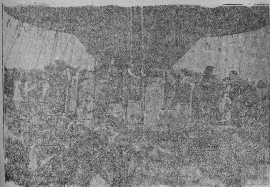
LA VERBENA DE SAN ANTONIO DE LA FLORIDA EN LA BOMBILLA.—Estudiantes y modistillas en la tradicional verbena madrileña