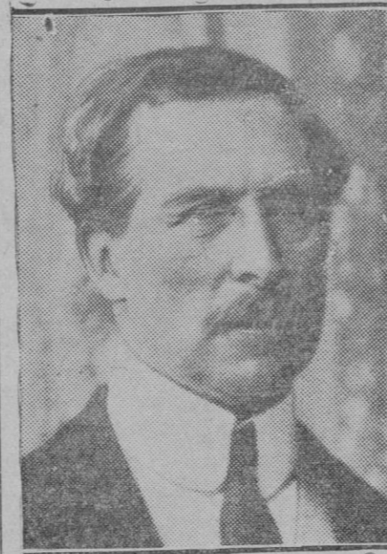
BELGICA. — El Rey Alberto I de Bélgica, recientemente muerto al caer en una ascensión que realizaba, destrozándose el cráneo