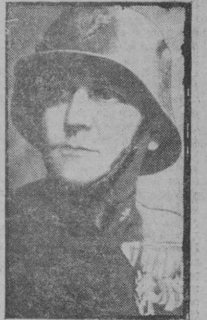
VIENA. — El vice canciller Fey, que dirigió las fuerzas federales para sofocar el movimiento socialista en Viena