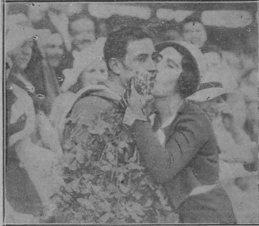
Speicher el vencedor de la Vuelta ciclista a Francia es abrazado y besado por su hermana al llegar al Parc des Princes en París final de la carrera

Por ser necesaria, repetidas veces la hemos interesado, al mismo tiempo que una vez más nos hacemos eco de las justificadas quejas que el vecindario de aquellas barriadas formula contra la insupportable molestia que vienen sufriendo por los hedores que despiden el fango corrompido amontonado en la orilla del puerto entre la desembocadura de la Riera y la barriada de Son Alegre.