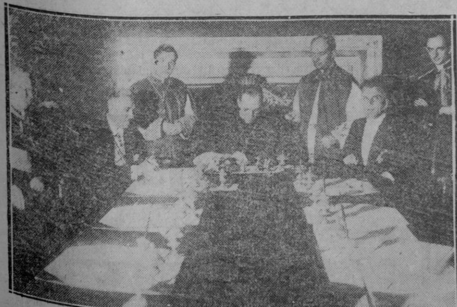
El vicescanciller del Reich, Von Papen y el cardenal Pacelli secretario del Vaticano firmando el Concordato entre la Santa Sede y Alemania