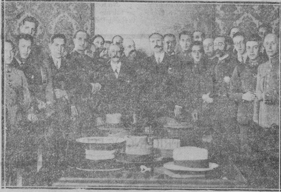
La vista por los sucesos de Agosto. — Grupo formado por los procesados antes de reanudarse la vista del proceso