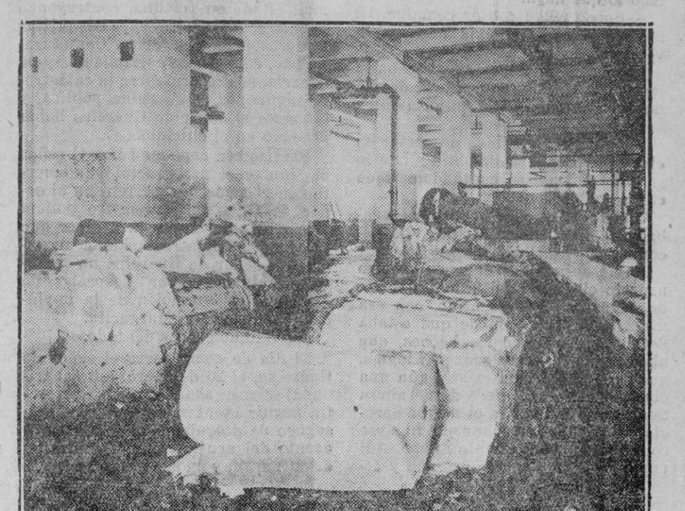
GUIPUZCOA. — La fábrica de bobinas de papel para periódico (ubicada en Rentería) después del temporal

Del 10 al 25 de Mayo se celebrará la Feria Muestrario de Valencia. En algunos lugares de Madrid hay carte-