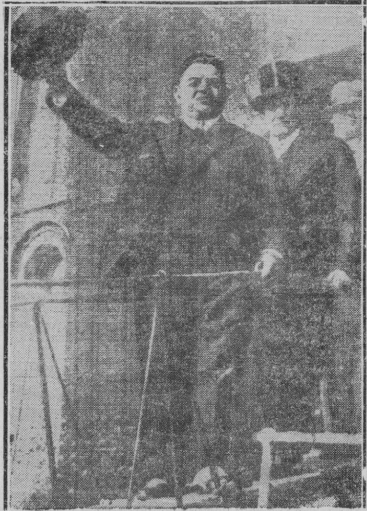
El Sr. Herriot, en el momento de desembarcar en Nueva Jersey, seguido del Sr. Gerard, antiguo embajador de los Estados Unidos en Berlín, que llevaba la representación del alcalde de Nueva York. (Fotografía transmitida por radio desde Nueva York a París.)

en efecto, los gobernantes y parlamentarios ingleses, con su sentido de la realidad, han comprendido y confesado más de una vez, que esta acción que llamamos propaganda del Estado o de la Nación es un espionaje y es una seducción y captación. Así, la relación del "Intelligence Service", para las funciones de propaganda en el Extranjero, no se limita a oficinas correspondientes establecidas en el "Foreign Office", en el "Colonial Office", en el "Almirantazgo" o el "War Office" (Ministerio de la Guerra) así como en el "Board of Trade", (Ministerio de Comercio) sino con la "Special Branch of Scotland Yard", o sea con una sección especial de la dirección de Policía.