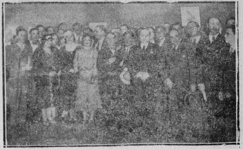
MADRID.—Asistentes a la inauguración de la Exposición humorista celebrada en el Círculo de Bellas Artes

Decir que unas Cortes Constituyentes deben vivir "mientras puedan sostener un Gobierno" es decir que aquéllas tienen el poder conferido no como un mandato, sino como cosa suya propia, de la cual no se apartan sino cuando les sea imposible conservarla. Esa es la usurpación de la soberanía nacional con una oligarquía. Es lo propio de la dictadura de grupo. Pero contrario a toda doctrina democrática, a toda conveniencia y prácticamente a toda posibilidad, lo demuestran sus resultados: no limitada la vida de las Cortes por el tiempo ni por el cometido, su duración puede ser indefinida, diez, quince, veinte años, sin que legalmente pueda ser interrumpida.