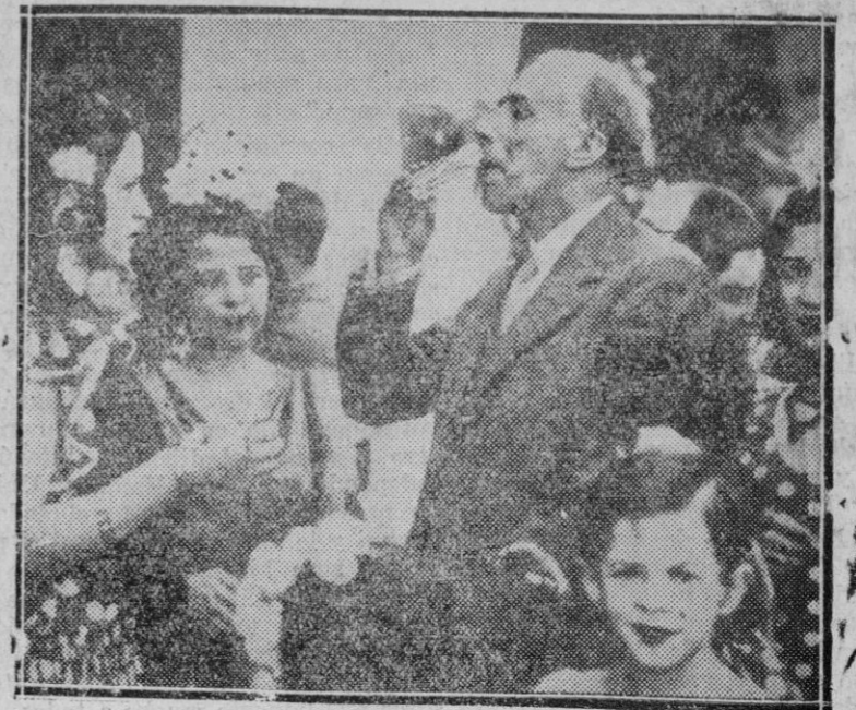
SEVILLA.—El Presidente del Congreso Sr. Besteiro bebiendo manzanilla en la caseta de la Asociación de la Prensa de la feria de Sevilla

Ante esta situación de inseguridad jurídica y ante la intervención creciente con que se amenaza a las Compañías ferroviarias, estas entienden que sería preferible la reversión anticipada de las mismas y han hecho esta misma declaración con toda rotundidad en las conclusiones que han elevado al Gobierno como resultado de las deliberaciones de esas Asambleas de transportes que acaban de tener efecto. Creemos honradamente que la estatificación anticipada de las redes en España produciría una verdadera catástrofe. Debe elegirse entre dos términos absolutos: o el principio de empresa privada o la estatificación pura y simple. Pero esa estatificación disimulada, anticipa-