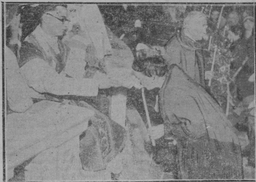
PROVENZA.—Un detalle de las fiestas que se celebran tradicionalmente en Provenza con motivo de la Misa del Gallo en la que se adora al Niño Jesús

Y Mallorca ha de honrar con más solemnidad que otro hecho alguno, el de la gesta gloriosa del invicto monarca aragonés que conquistó a esta isla incorporándola al mundo civilizado.