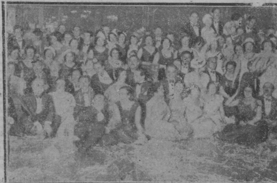
MADRID.—Un grupo de concurrentes a la fiesta de Pascua que como todos los años, se celebró en el Club Rosendo

sis europea es consecuencia directa del materialismo, que con mayor brutalidad cada día, invade nuestro continente. Profesores de la Universidad de Oxford y de la Universidad de Berlín, miembros de la Academia Diplomática de París y de la de Ciencias Morales de Berna, poetas, filósofos, llegados en peregrinación de distintos países han coincidido en que el fascismo, restauración de una terminología moderna de los ideales que hicieron de la Roma antigua la más grande empresa de la historia humana, es la única fórmula de salvación posible. Estos ideólogos soñadores y románticos vividores del pasado tiempo, pusieron término a su asamblea, evocando el dogma político del emperador Augusto: "Cedant arma togae..." y añorando aquella formidable confederación de pueblos invadidos y sometidos, que desde el Elba al Atlán-