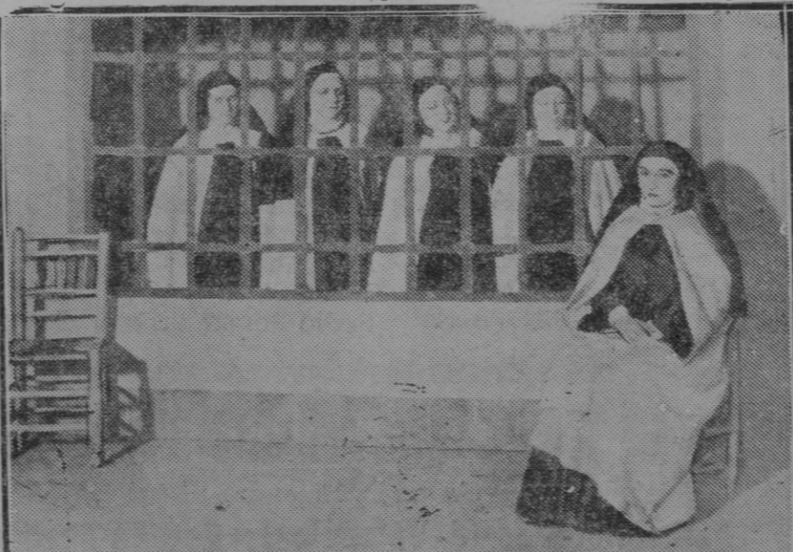
MADRID.—Una escena de «Santa Teresa de Jesús» obra de Marquina, estrenada con gran éxito

—¿Por qué esa polémica tan agostada por un pozo de agua, señores? —Pérdeme usted, señor presidente. —responde uno de los abogados—Eso pozo, para nosotros es de un valor extraordinario, porque precisamente nuestros clientes, tienen montado el negocio de vinos.