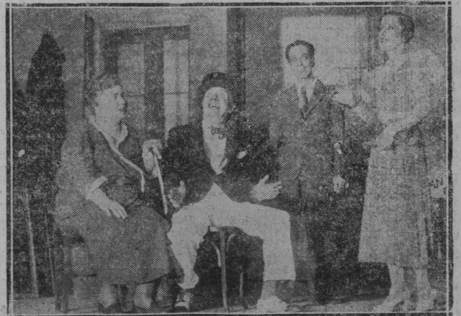
MADRID.—Teatro Infanta Isabel. Se ha estrenado la obra de Pepito Fernández del Villar titulada "D. Pedro el Cruel o los hijos que mandan," con un gran éxito

La excesiva cuantía del presupuesto, en déficit o con superávit,—igualmente abruma el tributo pagado directamente por el ciudadano que la deuda cargada sobre la nación entera,—origina el coste excesivo en la producción y el encarecimiento de la vida. No sólo se merma así la capacidad de consumo y de compra de cada ciudadano, con lo que se engendra la crisis en el