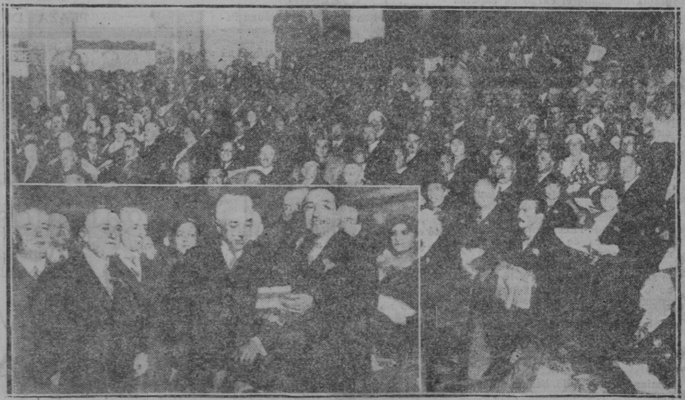
MADRID.—La sesión inaugural del Congreso de Otorinolarinología. El Jefe de Estado Sr. Alcalá Zamora con un grupo de congresistas en los salones del Círculo de Bellas Artes, un aspecto de la sala, en la sesión inaugural del Congreso de Otorinolarinología

Lonjeta, 53 Artículos para Colegiales y Normales