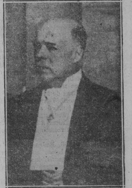
El ex duque de Sevilla que ha sido detenido como complicado en la intenciona contra el régimen