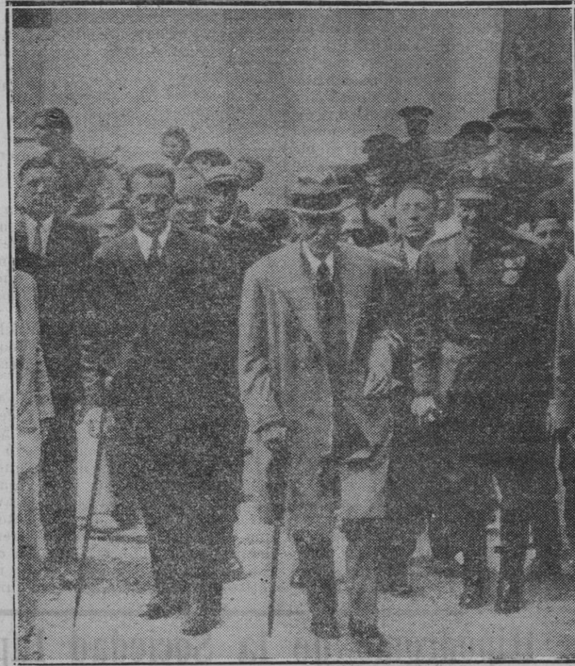
El Presidente de la Generalidad Sr. Maciá en una de las excursiones recientemente realizadas por algunos pueblos de la provincia de Gerona a su llegada a la villa Solinía, acompañado del Gobernador civil de la provincia.

Esta sola finalidad justificaría las obras iniciadas ayer, y su realización hará al Ayuntamiento acreedor a la gratitud de todo el vecindario, pues aún cuando afecte a una zona de la población, el temerario sistema que actualmente se utiliza compromete la salud de todos los vecinos.