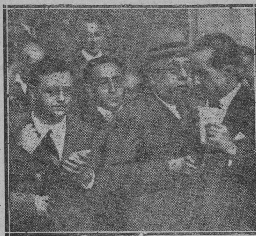
Madrid.—El Presidente del Consejo de Ministros a su salida del Palacio Nacional después del Consejo con el Sr. Presidente de la República dando cuenta a los periodistas de algo de lo que en él trataron

—Pero eso no es vanidad—contestó la amiga.— Eso es fantasía.