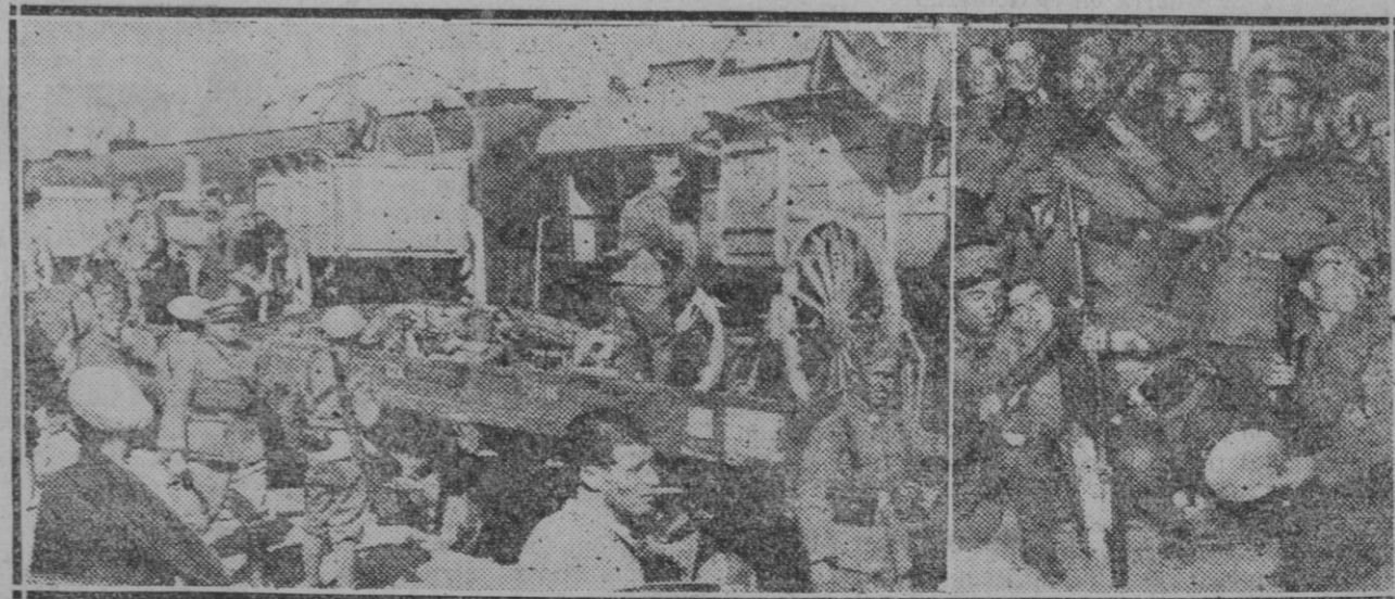
SEVILLA. — MOVIMIENTO DE TROPAS. —1.º Momento de llegar a la estación de Sevilla un tren militar con material de guerra y tropa para ir contra los rebeldes.—2.º Grupo de soldados a su paso por Córdoba procedentes de Madrid con irreción a Sevilla.

Bucarest.—Se reciben noticias de Galatz dando cuenta de haber estallado un depósito de municiones. La explosión fué advertida en la población registrándose numerosos pequeños daños. Se cree que este acto es obra de un atentado de los terroristas.