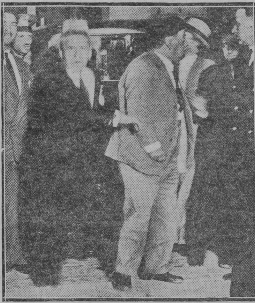
MTDRID. — Llegada a la Dirección General de Seguridad del General Sanjurjo a raíz de su detención hecha en Huelva.