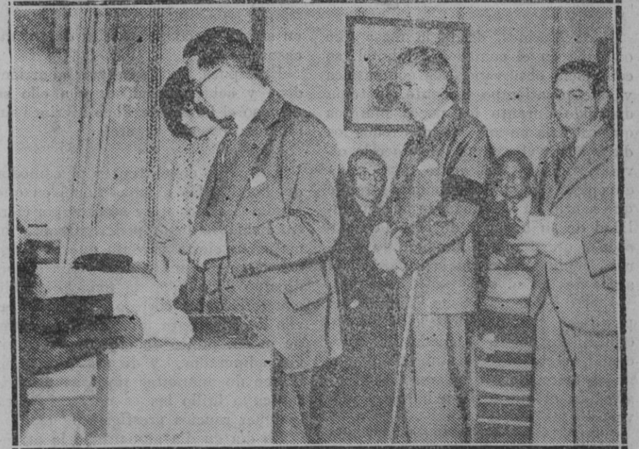
BERLIN.—Las elecciones en Alemania.—El Canciller von Papen espera turno para emitir el voto

Bien está, desde luego, que se dicten medidas, aunque escasas, a fin de corregir tal estado de cosas, pero sería mejor, desde luego, educar a la gente a fin de que no sintiera inclinación por esa literatura morbosa. Ya sabemos que esta es tarea larga que por otra parte cuando un desgraciado o halla en su vida ningún motivo de satisfacción, se inclina, irremisiblemente al vicio que de un modo pasajero y más o menos perjudicial le brinda algún placer o el olvido de sus penas. También nos damos cuenta de que la miseria es un gran incentivo para el vicio, hasta el