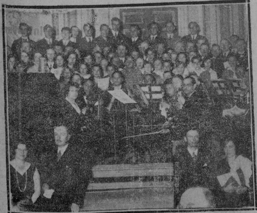
Banquete con que la sociedad Peñalara de Madrid, ha obsequiado a los triunfadores del concurso de esquíes celebrado en Barcelona