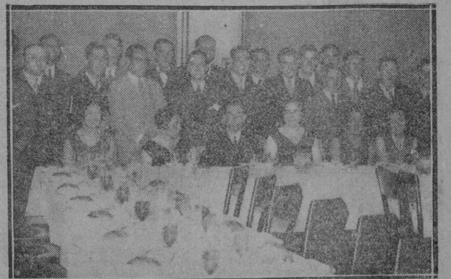
MADRID.—Teatro Conservatorio. Celebración del Centenario de Goethe de la colonia Alemana en esta Capital con asistencia de varias personalidades y el embajador

No hay nada que conmueva tanto la entraña de un país como su constitución rural. El suelo es el asiento de las civilizaciones y por ello ahora se lucha por su distribución entre el bolchevismo y sus simpatizantes con cuantos seguimos teniendo fé en la propiedad privada y la libertad económica.