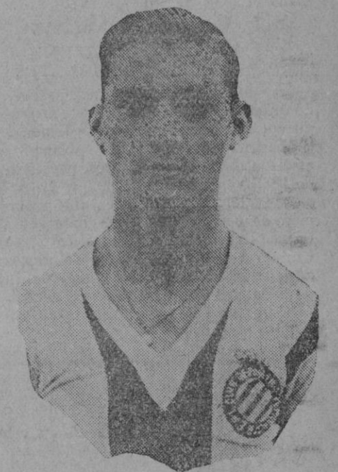
El notable jugador españolista Bosch que con sus compañeros ha llegado esta mañana

JULIO A. REBORA. (Reproducción prohibida).