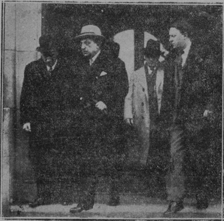
PARIS.—De la muerte de M. Briand.— Monsieur André Tardieu, presidente del Consejo de ministros, saliendo de la casa del ilustre político fallecido en la avenida Kléber, después de visitar el cadáver y dar el pésame a la familia.

Este criterio que lo hubimos de sustentar porque entendimos que era el que a Mallorca convenía, lo hemos visto compartido por muchos y significados elementos, celebrando muchísimo que entre estos figuren quienes por sus cargos pueden hacer que prevalezca, ya que de seguirse tal criterio el próximo viaje presidencial puede ser altamente favorable para los intereses de nuestra región.