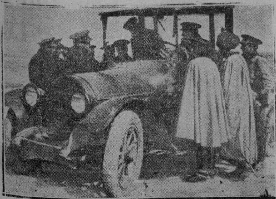
MADRID.—Escuela de tiro del Campamento.—Curso para oficiales de carros ligeros de combate. Los oficiales recibiendo lecciones de mando de coches.