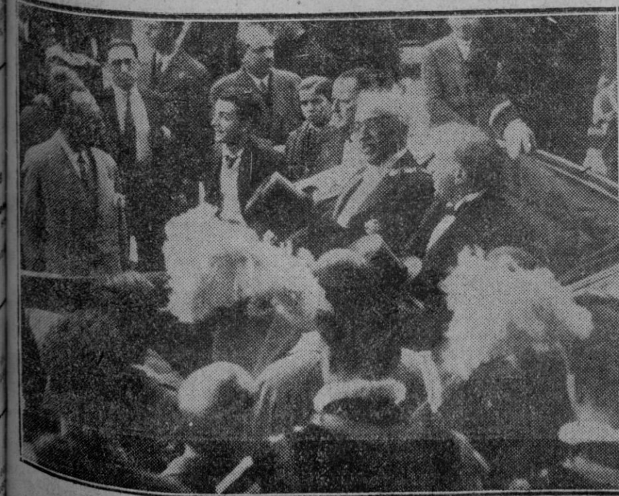
MADRID.—El Presidente de la República acompañado de la Cámara salen del Congreso para dirigirse a Palacio