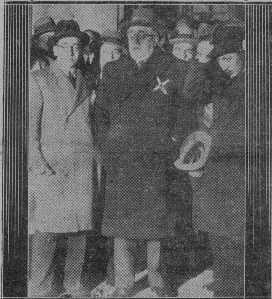
MADRID.—Don Manuel Azaña al salir de Palacio con el encargo de formar Gobierno

De ser acertadas estas conclusiones, se pondría término al horror incoercible que siempre ha suscitado esta terrible enfermedad y que condenaba a los desdichados que la padecían a un aislamiento feroz que les borraba en realidad del mundo de los vivos.