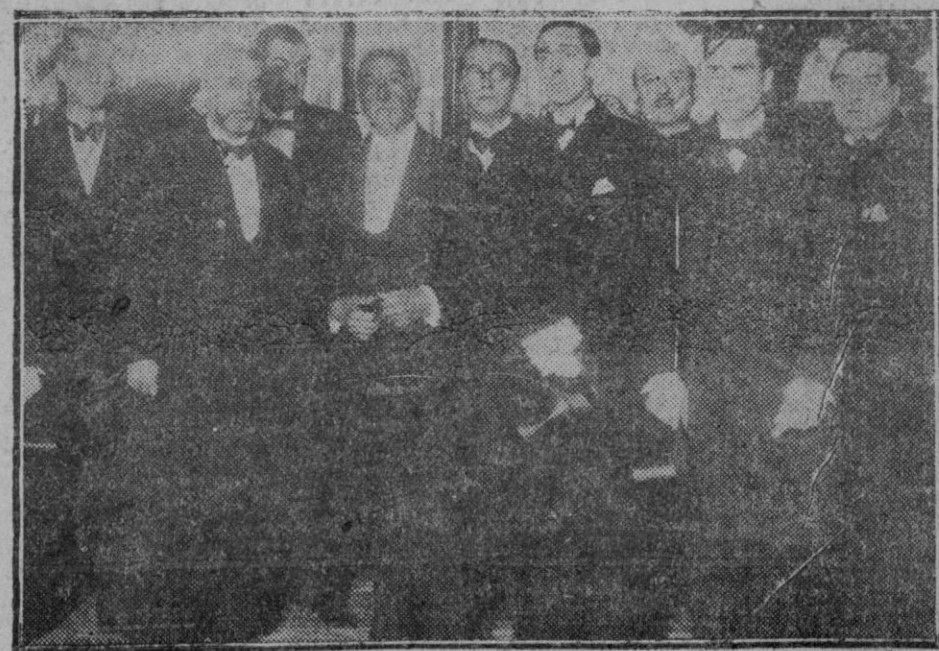
MADRID.—El Jefe del Estado señor Alcalá Zamora en su casa al llegar la Comisión de la Mesa de la Cámara