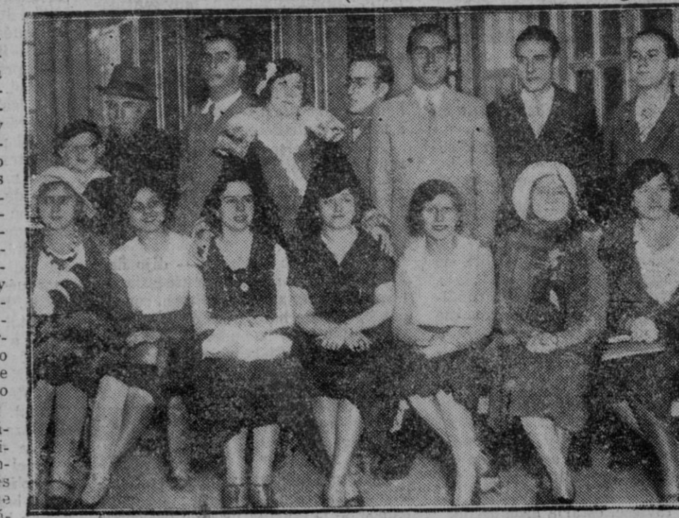
MADRID.—Teatro M. Guerrero.—El cuadro artístico "La Farándula," que ayer día 1.º de Noviembre puso en escena la comedia "Los frescos," de Muñoz Seca, en función a beneficio de la Bolsa de Socorro de Inválidos del Trabajo.

cuencias de semejante falseamiento. Nuestros buenos burgueses siguen sin enterarse del cambio de hora que ha impuesto una nueva fisionomía al mundo. No cabe desconcierto mayor ni más peligroso—para ellos—que el suyo. Y ese desconcierto ha acabado de hacerse palmario en estos primeros tiempos de la República. Si esos hombres tuvieron un mínimo de sentido común, si fuesen capaces de ver la realidad de otro modo que con anteojeras apollinadas, caerían en la cuenta, de que, desde un punto de vista inteligentemente burgués nunca ha tenido España un gobierno, un parlamento, una vida política equiparables, en decoro nivel moral y eficacia a los actuales. Y no lo digo movido de un optimismo a ciegas. Ese gobierno, ese parlamento, tienen, desde luego sus defectos. Sus defectos, porque de excesos no cabe hablar aquí honradamente. ¿Su radicalismo? Los radicalismos suelen ser—lo son manifiestamente en el caso concreto de la política española de hoy—reacciones lógicas determinadas por anteriores radicalismos de signo contrario. El clericalismo, la intolerancia de antes en todos los