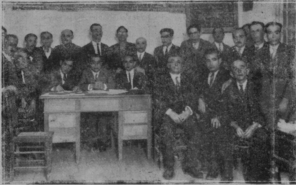
MADRID.—En la "Federación social de Sindicatos Unicos,"—Apertura de la Asamblea Nacional de obreros de la industria pesquera y sus derivados

Mejor ocasión no se nos deparará para solicitar la restitución de aquellos elementos históricos, que tan a disgusto de la ciudad, según refieren las crónicas, fueron llevados a Madrid el año 1830.