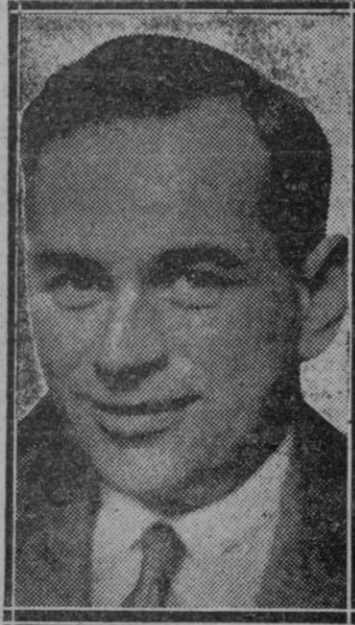
EXTRANJERO.—Parker Cramer, aviador norteamericano, que salió de Groenlandia para efectuar un vuelo trasatlántico, y del cual no se tienen noticias desde el domingo

Pero Aurelia Joz repetía siempre: "Es preciso encontrar capital para esta obra de salud femenina... Y al fin halló personas que le ayudaron con sus esfuerzos; el Ministro de Agricultura y las Cámaras de Comercio vinieron en su socorro. Se le dió