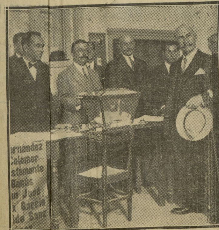
MADRID.—En Alejandro Lerroux, ministro de Estado, al llegar al colegio para depositar su voto