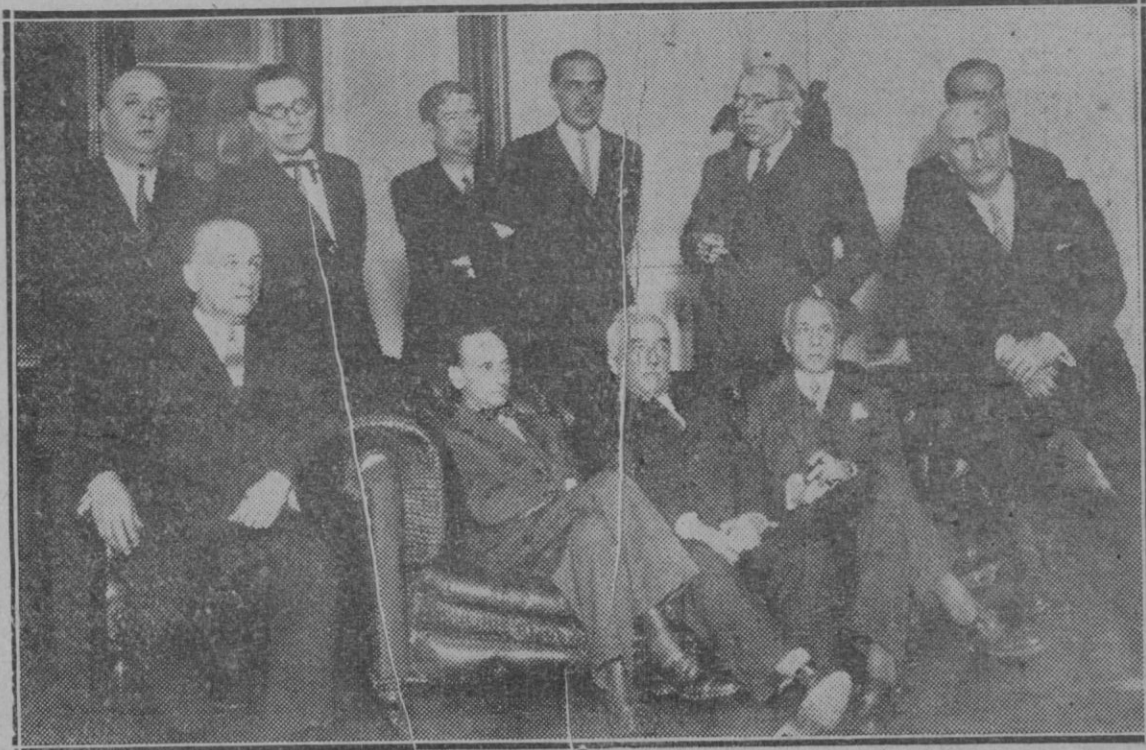
MADRID.—El Gobierno, reunido en Gobernación, después del almuerzo, al que concurren todos los ministros, excepto el señor Martínez Barrios que se encuentra en Sevilla

El dumping de maderas ha causado serias pérdidas ya a las explotaciones forestales austriacas y yugoeslavas. Holanda y América han visto llegar a sus mercados grandes cantidades de trigo. Los aceites pesados y las bencinas rusas concurren en casi todos los mercados desplazando a los productos americanos y