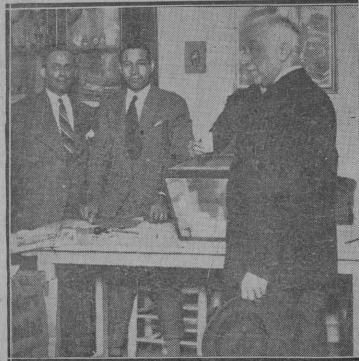
MADRID.—D. Niceto Alcalá Zamora, Presidente del Gobierno provisional de la República, en el momento de ser depositado su voto en la mesa