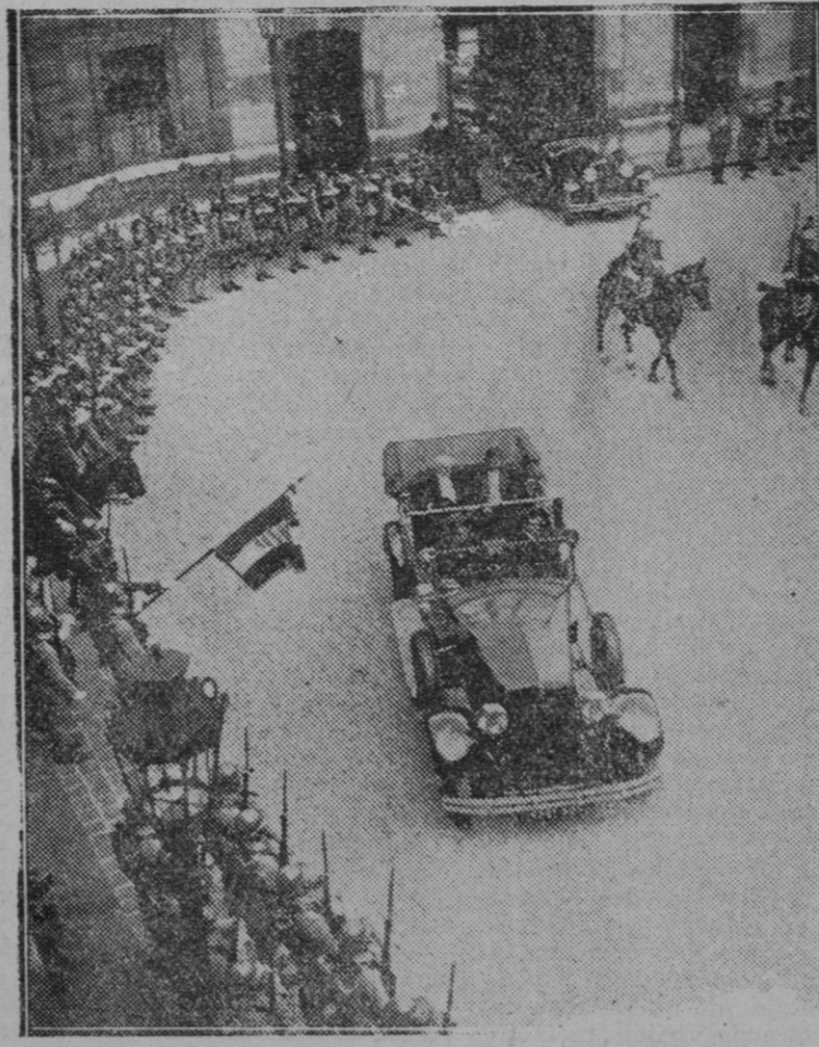
EXTRANJERO.—El señor Paul Doumer, elegido Presidente de la República en la Asamblea Nacional del 13 de Mayo, a la salida del Eliseo, acompañado por el señor Laval, presidente del Gobierno.

Todo ello debe avivar el interés de todos en conseguir cuanto antes la construcción de la Casa de Correos.