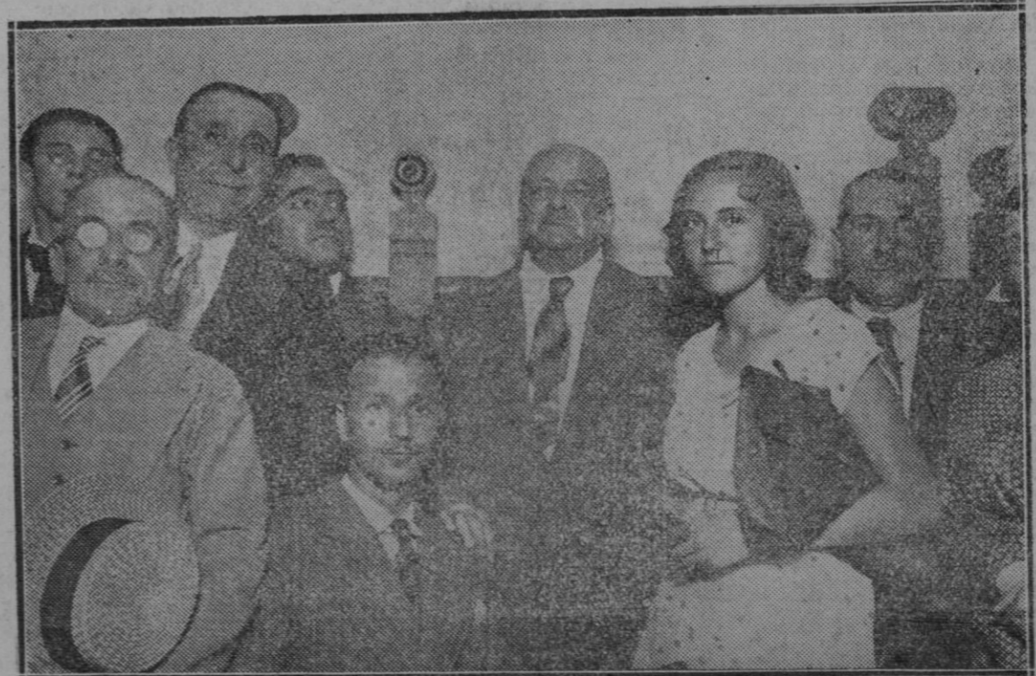
MADRID.—Don Rodrigo Soriano, después de la conferencia que dió días pasados en el Ateneo.

"El encanto de estos cuadros (con estar muchos de ellos dibujados soberbiamente y pintados con una espontaneidad elemental e insuperable) es ultra-pictórico. Se funda en el poder de evocación y de misterio que en ellos flota, difuso y tenue. Se funda en la emoción que provocan o comunican. Más que traslados fieles de la naturaleza "inerte" son estados de espíritu descubiertos en la naturaleza por el espectador; algo así como reflejo de fronda en los lagos azules del ensueño. Aunque con la mayor sobriedad con una completa simplicidad de recursos y una ausencia más completa todavía de quimeras simbolistas, me producen estos cuadros de Rusiñol el efecto profundo de la poesía... Es un género de