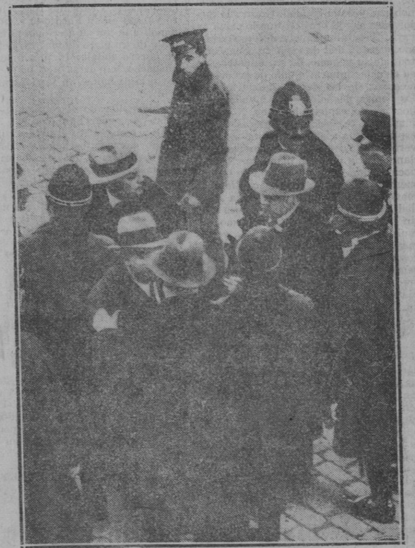
MADRID.—Los sucesos en el Ateneo.—La fuerza pública, después de desalojar el edificio del Ateneo, procede a la detención de la Junta directiva del Ateneo y dispersión de los grupos Ateneístas

Esto es lo que los maestros y profesores de todo el mundo deberían dar a entender a las nuevas generaciones. Y si lograsen inculcarles el horror a la guerra, que nunca es fecunda más que en desgracias, en miseria y en ham-