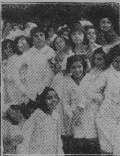
MADRID.—Su Majestad la Reina saliendo de la Iglesia de las Calatravas.—Su Alteza la Infanta doña Cristina en el Cuartel de Alabarderos, rodeada de los pequeños entre los cuales había repartido juguetes

sotros. Estudiamos y hacemos comparaciones.