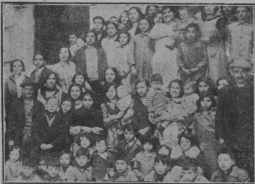
MADRID.—Grupo de vecinos de la calle del Ventanillo agraciados con modestas participaciones del segundo premio

con caracteres gravísimos aqueja al mundo.