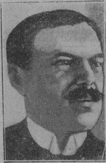
EXTRANJERO.—Sir John-Norton Griffiths, ingeniero inglés y ex diputado en la Cámara de los Comunes, que ha sido muerto misteriosamente en Egipto