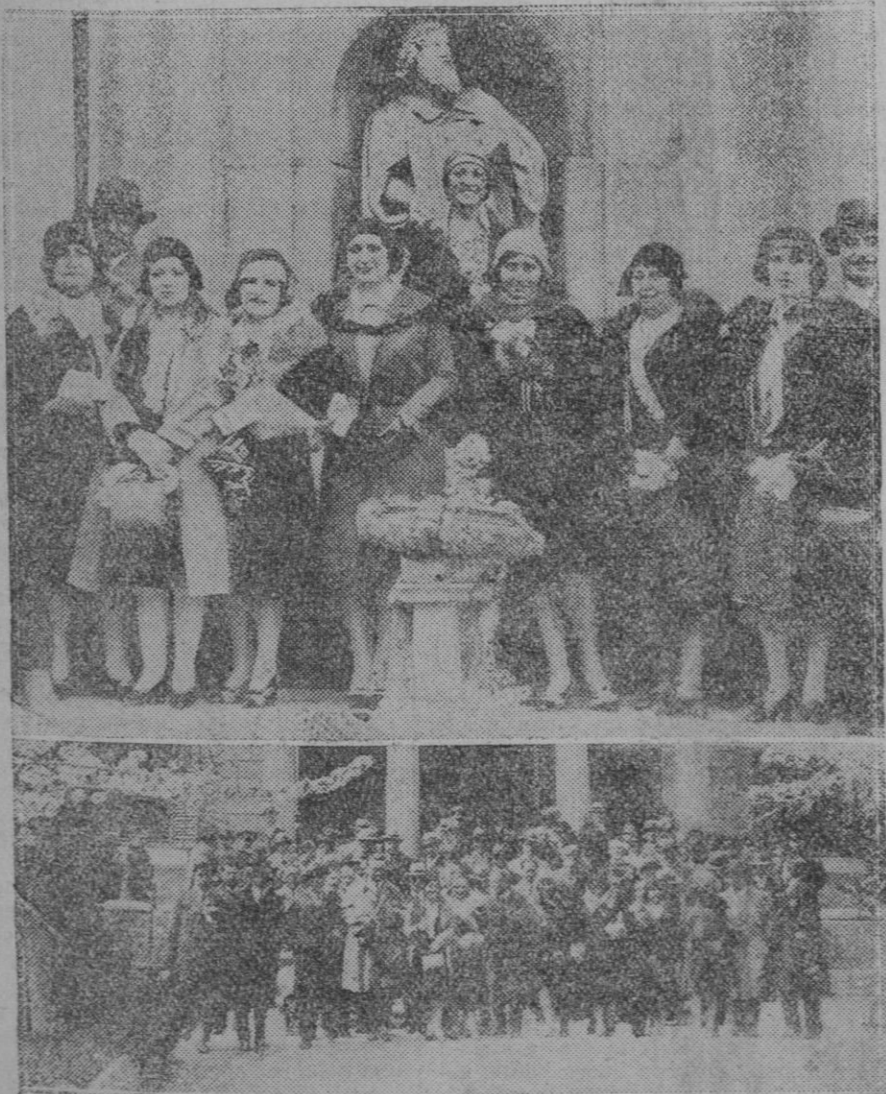
DESPELIDA A LOS PERIODISTAS HISPANO-AMERICANOS. —Arriba: grupo de bellas señoritas, acompañantes de los periodistas hispano-americanos en el patio de los Evangelios, durante la visita que hicieron a El Escorial.—Abajo: Los excursionistas al salir de la Casita del Principe

Se cree que la nueva arma ha sido elegida por el Cuerpo de Guardias de Seguridad para darle un aspecto más pacífico, puesto que hasta ahora cor el rifle y el revólver a la cintura; a los guardias de Seguridad de Colonia parecían un Cuerpo militar y no una organización destinada al mantenimiento del orden público.