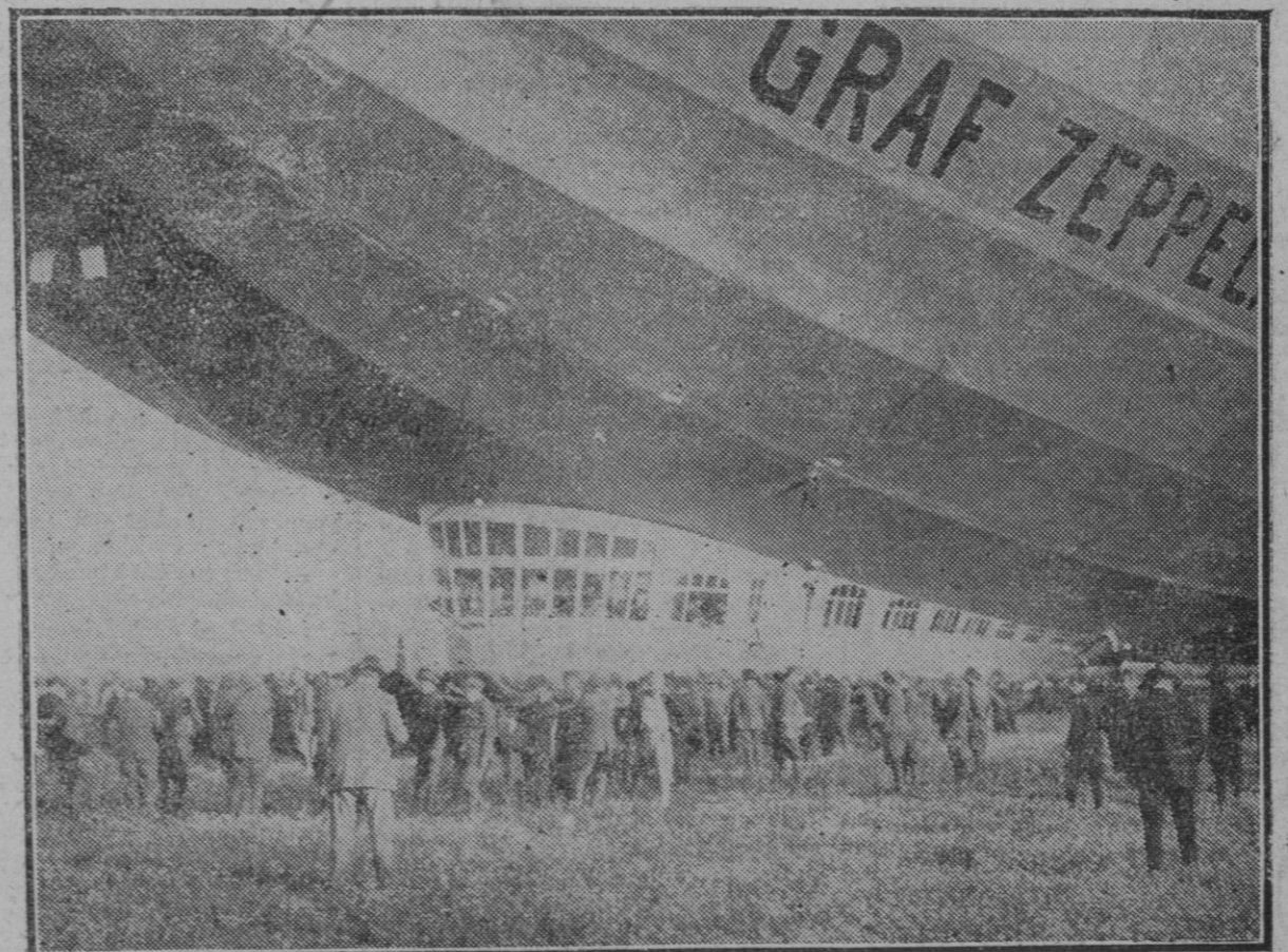
SEVILLA.—El "Graf Zeppelin", en el momento de aterrizar en el Aerodromo, en que se ve a la Familia Real y autoridades dirigirse a él para visitarle