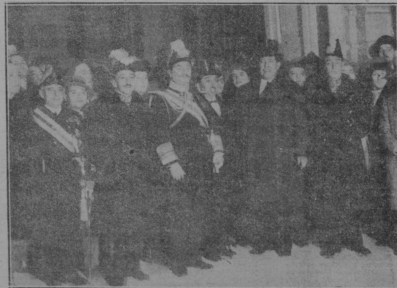
MADRID.—El General Berenguer con los nuevos ministros al salir de palacio después de prestar juramento ante el Rey

—¿Supongo que habrá invitado a técnicos a presenciar los experimentos?—preguntamos.