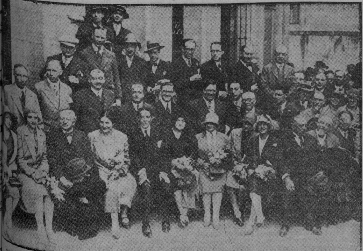
TOLEDO.—Grupo de asistentes al Congreso Internacional de Autores, en el patio del Alcázar, durante la visita hecha a esta capital.