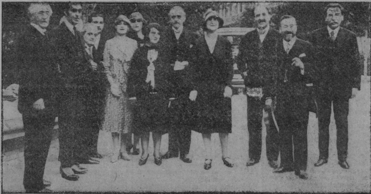
MADRID.—El conde de Bernstoff, con varios miembros del Congreso pro-Sociedad de Naciones, en la Residencia de Estudiantes, donde dió una notable conferencia.