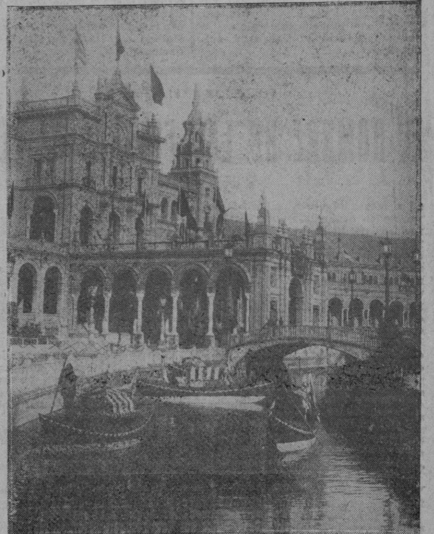
SEVILLA.—El canal de las góndolas venecianas, una de las notas más pintorescas de la Exposición Iberoamericana que está llamando poderosamente la atención por los millones de visitantes que acuden a diario.

Hay que hacer mucho todavía aunque oeste algún sacrificio. Pollensa se lo merece.