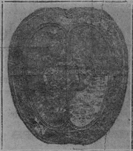
Adarga de fines del siglo XVI. Trabajo mejicano en mosaico de pluma que se guarda en la Real Armería de Madrid.

Donde se habla de las turbaciones de Aragón.