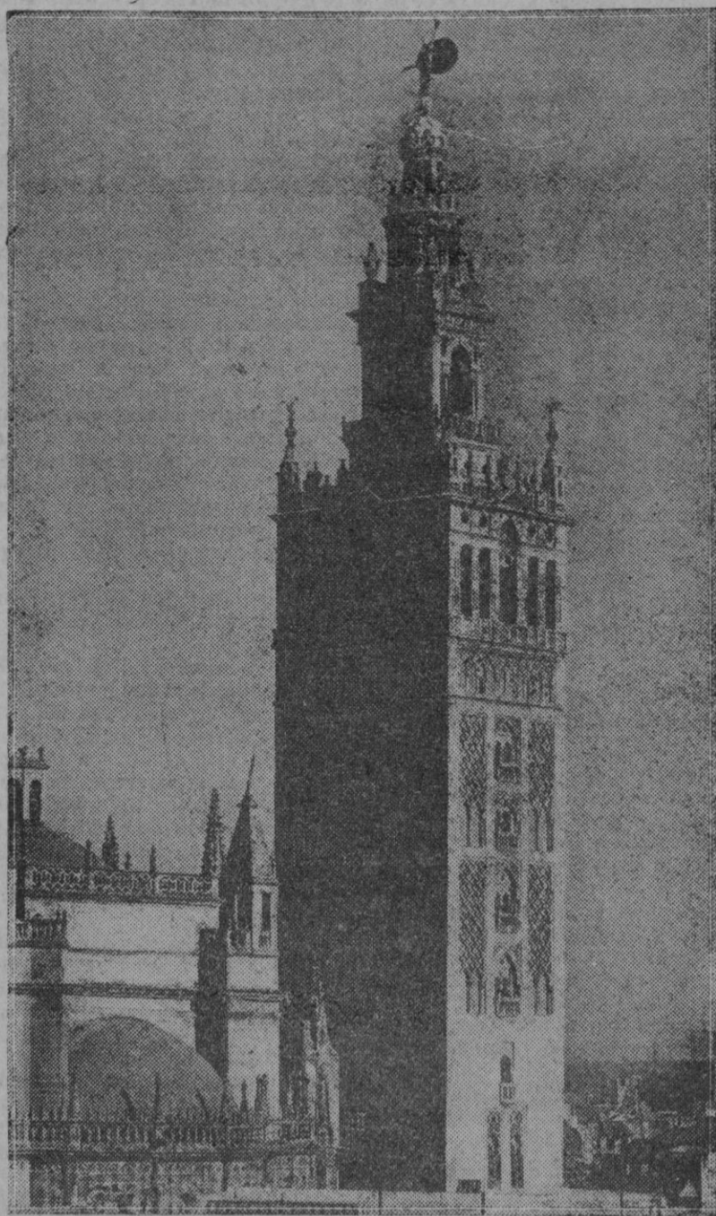
Como desde este momento hasta que se inaugure la Exposición de Barcelona la única actualidad nacional es la Exposición de Sevilla, iremos publicando a diario los pabellones internacionales y nacionales del hermoso recinto, inaugurándolo hoy con la maravillosa Giralda, monumento representativo de la bella capital andaluza.

Como periodistas venimos obligados a expresar nuestro sentimiento de gratitud en memoria de quien trajo la iniciativa de construir dicha Casa, y aportó un millón de pesetas para contribuir a la realización de tan noble propósito, y la expresión de esa gratitud no priva que decimos al propio tiempo el elogio merecido a quien realizó acto tan generoso como el de ofrecer parte de su patrimonio a los elementos que fueron los que colaboraron a las empresas que fundara el ilustre periodista.