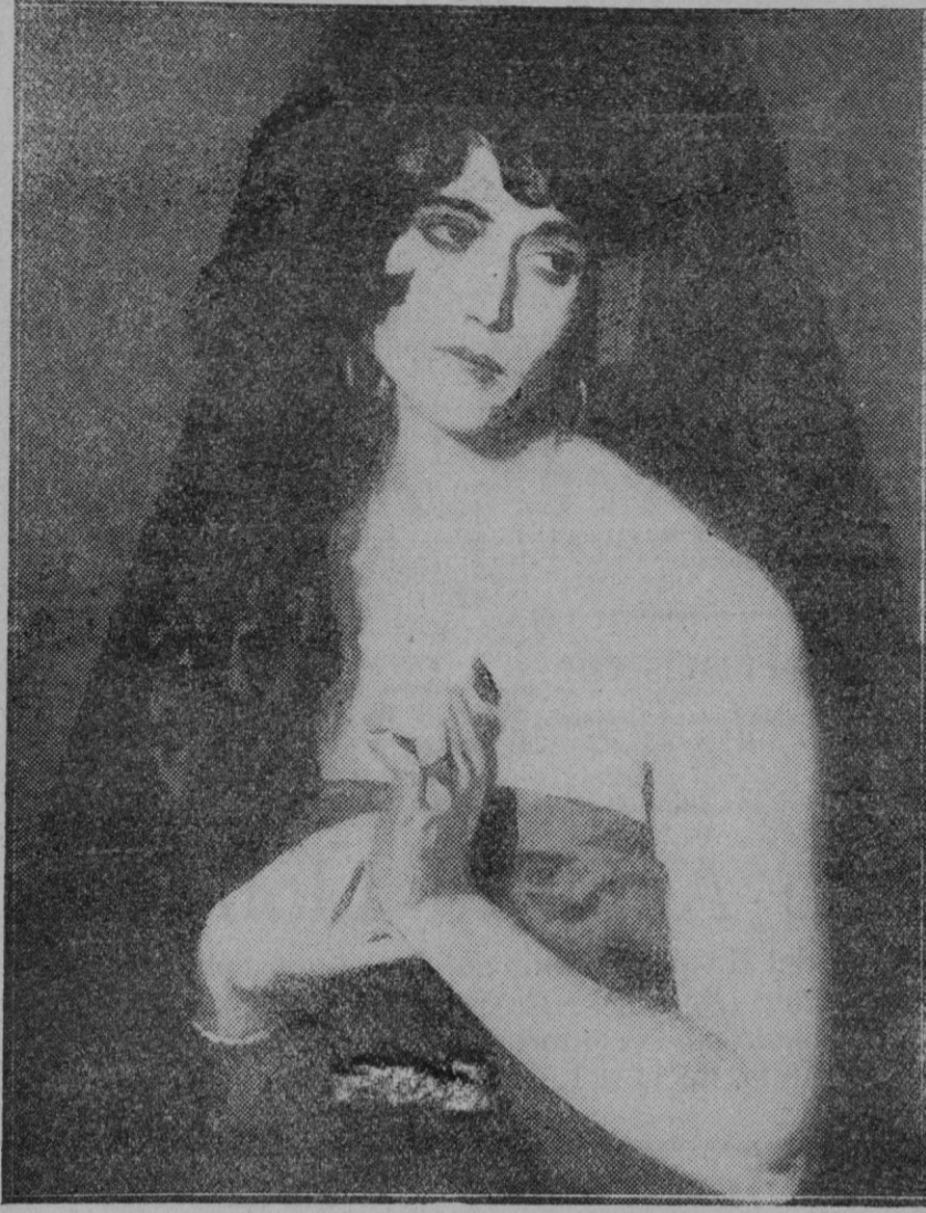
MADRID.—En el Palacio de Bibliotecas y Museos se está celebrando una interesante Exposición de interpretaciones de los tipos femeninos creados por los Hermanos Alvarez Quintero.—Esta fotografía representa a «Pepita Reyes», cuadro de Francisco Soria Aedo, que está llamando poderosamente la atención.

Tales propósitos, en extremo plausibles, en extremo beneficiosos para el interés público, en los cuales se anima la Compañía de los Tranvías Eléctricos Interurbanos, son merecedores no tan solo de un fervoroso aplauso por parte de quienes nos preocupamos por el engrandecimiento de la ciudad, sino que son dignos de que por parte de todos se les preste el más decidido apoyo a fin de que cuanto antes sean llevados a feliz término, con lo que al propio tiempo que se favorecerá a la ciudad, se acrecentará el valor de una empresa que por ser genuinamente mallorquina y por ser benemérita, debe merecer y merece generales simpatías.