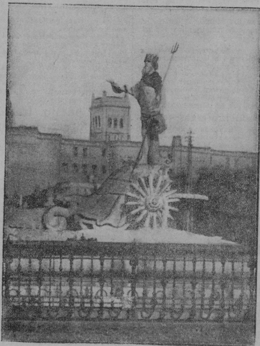
MADRID.—La estatua de Neptuno, dios de las aguas, a quien durante la noche unos bromistas—iguales que hace pocos meses hicieron con la Cibele, —han colocado un mantoncillo viejo y harapos para resguardarle de las inclemencias de las noches.

Seguindo en nuestra actitud hemos de reiterar nuestro criterio, ahora que diversos elementos artístico musicales han propugnado resientemente acerca del Ayuntamiento para que éste se decida de una vez y de acuerdo con las reiteradas proposiciones que significados elementos de la Corporación Municipal han formulado, a crear una banda a su cargo o bajo su patronato efectivo.