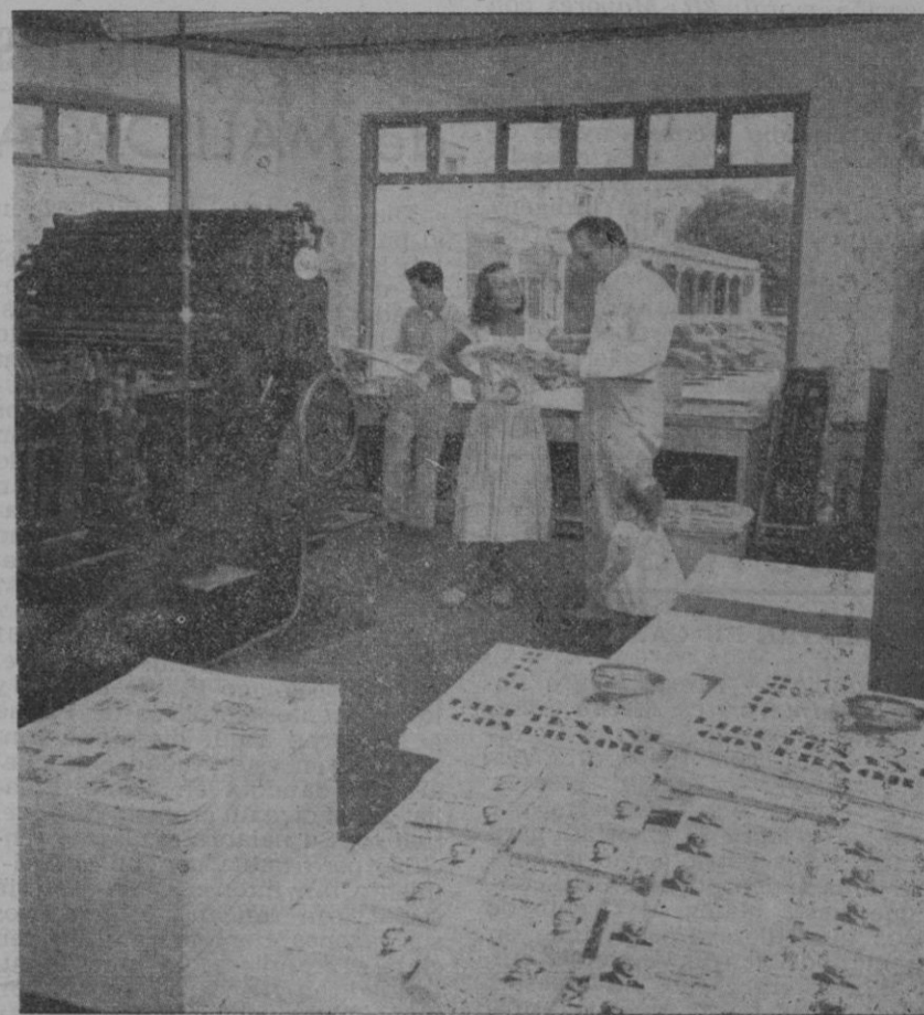
El papel, en la actualidad, es uno de los productos de mayor importancia para el desenvolvimiento, tanto industrial como comercial de la humanidad. Su consumo es enorme y de suma necesidad en muchos aspectos. En el grabado, unos talleres de imprimir periódicos y revistas

En cuanto al color del papel y su origen recordaremos que fué en Inglaterra donde se inventó por casualidad el teñido del papel, cuando la esposa de un fabrican-