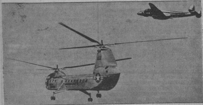
Cualquier aparato en vuelo puede recibir instrucciones y datos de las estaciones protectoras de vuelo instaladas en los puntos estratégicos

El aeropuerto de Zurich-Kloten equipado con los perfeccionamientos técnicos más modernos, permite despachar por hora unos mil quinientos viajeros de llegada y otros tantos de salida. Para terminar, añadiremos, a título de orientación, algunas cifras que juzgamos de interés. Movimiento total durante el año 1952: Vuelos, 36.053; pasajeros, 372.832; toneladas de correo, 2.409; toneladas de carga, 6.406. Movimiento diario medio: Vuelos, 99; pasajeros, 1021; toneladas de correo, 6'6; toneladas de carga, 17'5. — Un tercio de la circulación de pasajeros corresponde al tránsito.