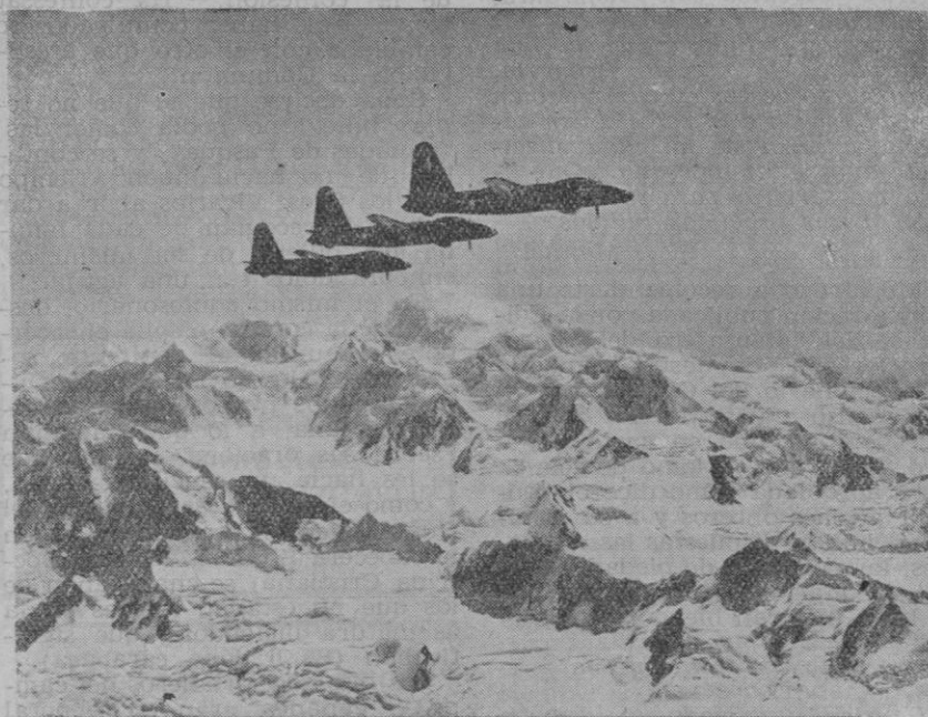
Los enormes progresos técnicos permiten a la aviación efectuar vuelos regulares sobre cualquier territorio

El gran hall de los pasajeros produce una impresión imponente. Con una altura de dos pisos,