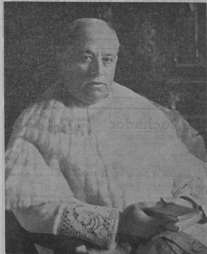
El M. I. Rdo. Sr. Miguel Costa y Llobera, poeta mallorquín. en cuyo honor Mallorca celebra el centenario de su nacimiento.