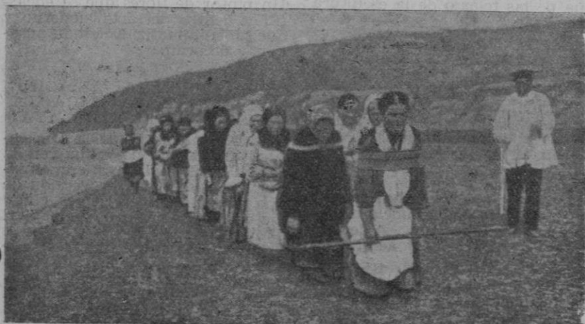
Como si fuesen bestias de carga, vemos aquí un grupo de mujeres, vigilada por un capataz con knut (látigo), arrastrando penosamente una barcaza a orillas de un río.