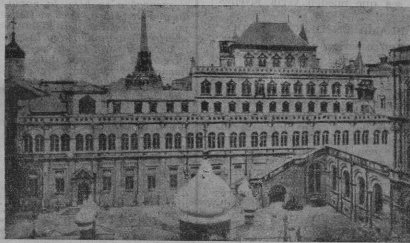
El Kremlin simboliza el mayor peligro para la paz universal

tomaron parte sucumbieron ocho millones (Alemania, Austria Hun-