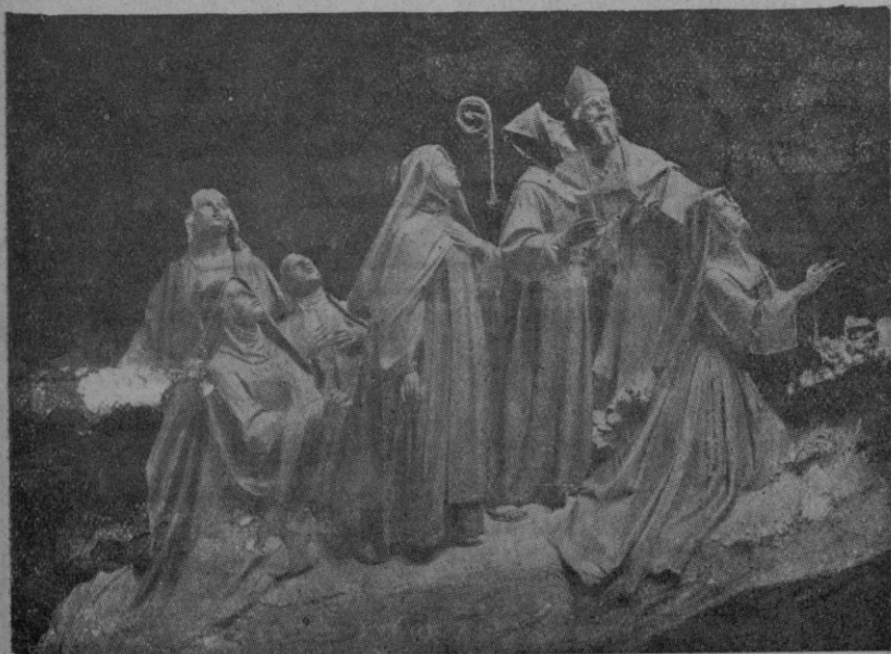
Cerro de los Angeles. Grupo escultórico de la derecha.