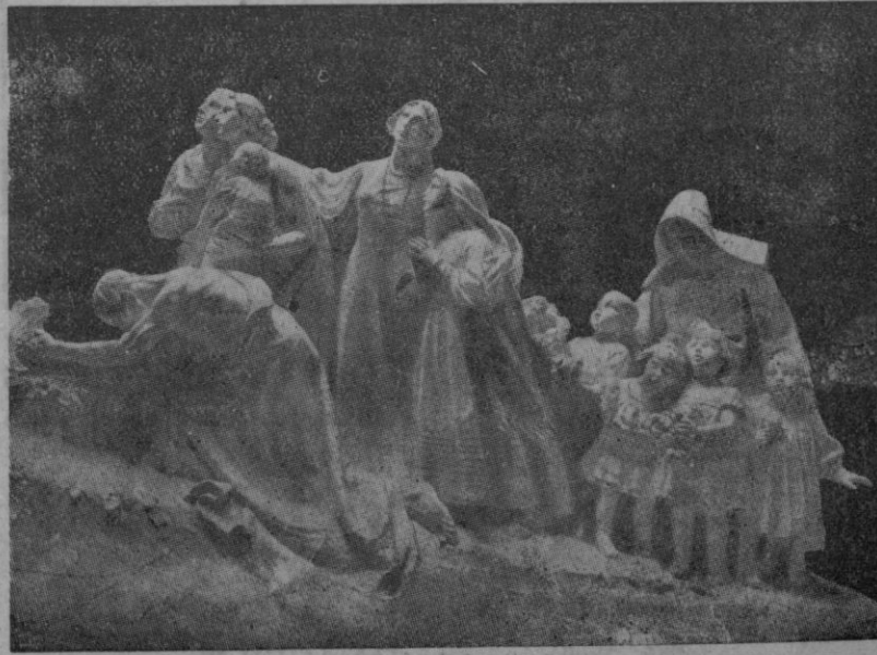
Cerro de los Angeles. Grupo escultórico de la izquierda.

Se afirma que el procedimiento para la disolución de la organización tendrá dos fases: primera, se incoará un procedimiento ante los Tribunales para disolverla, y segunda, todas las pruebas que puedan reunirse en dicho procedimiento legal serán remitidas a las autoridades correspondientes.