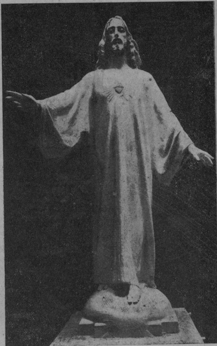
Imagen del Sagrado Corazón que coronaba el Monumento.