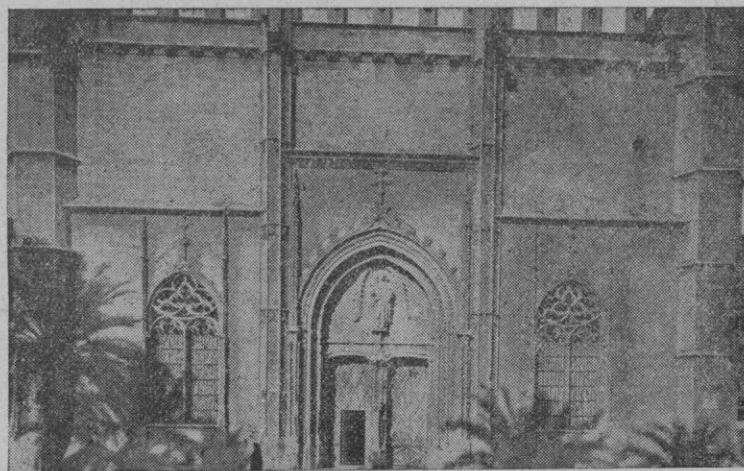
LONJA - Fachada principal