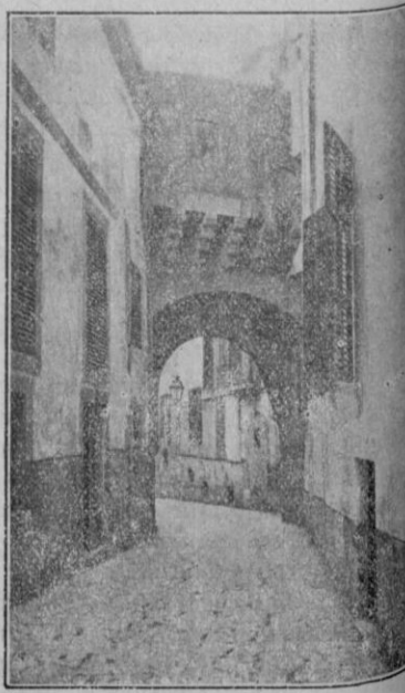
Arco de la Almudaina

—No. Yo siempre que comía en casa de D. Ramón me marchaba antes de los postres.