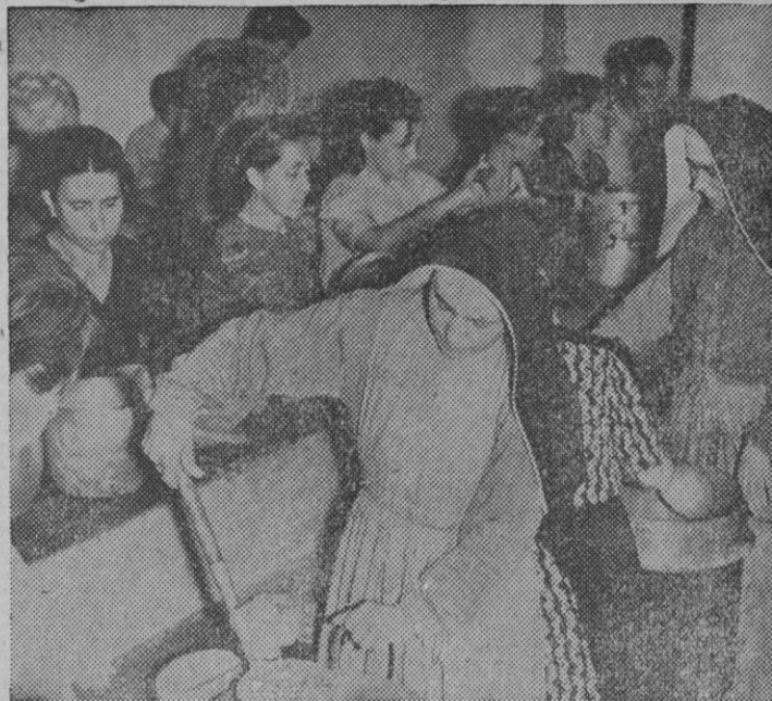
Hermanas Católica de los Pobres distribuyendo víveres en un centro de distribución en Roma.