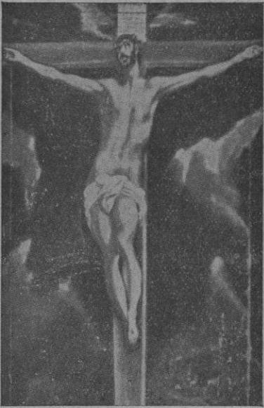
Cuadro del Greco

Desde hace veinte siglos, que la Iglesia nuestra madre año tras año, nos recuerda el histórico episodio universalmente conocido de la muerte del Salvador, sin cuyo gran sacrificio, el mundo hubiera perecido sucumbiendo en el caos, de la manera más