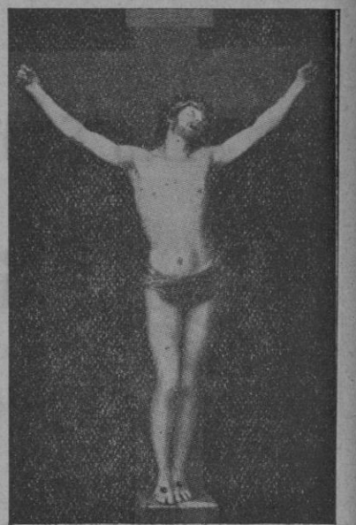
Cuadro de Murillo

Jesucristo muerto en la cruz, es el símbolo de nuestra redención, para no naufragar en este mar innumero de pasiones que es la causa primordial de las guerras y las desdichas que desangran a las naciones. En estos días de penitencia recojamos su sangre que vertió por nosotros y roguemos para que se apiade del mundo, y que venga una nueva era de paz du-