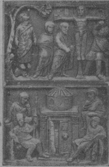
Marfil del Museo Británico (Siglo V)

«Y hallándoles dormidos les dijo: «Levantaos que ya está ahí el que me ha de entregar» Pues de todos es bien conocido como Judas el más traidor que vieron los siglos, entregaba a su Maestro. Aquí podemos considerar las befas y sufrimientos de nuestro buen Jesús. Los grandísimos dolores de la Virgen, a las santas mujeres y a su discípulo amado, S. Juan, fidedignos representantes del valor y del cariño, y en fin, a todos los personajes que más o menos directamente to-