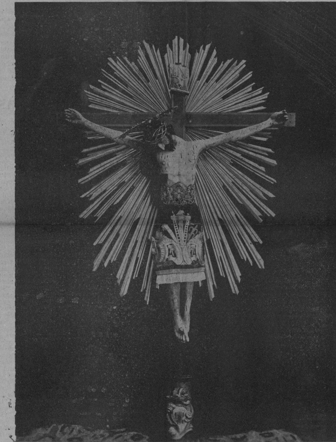
Santo Cristo de la Sangre

Un balanceo general de la muchedumbre callejera y charlatana me ha hecho volver la cabeza. Cien uñas negras, sucias de polvo y miga de pan moreno, han señalado unánimemente a un hombretón, de revueltas greñas y áspera barba, que va allá, discursando y gesticulando, al frente de un corro numeroso. Se me va despertando mi curiosidad frívola de buen latino. Habría en todo esto una información interesante. He preguntado a una