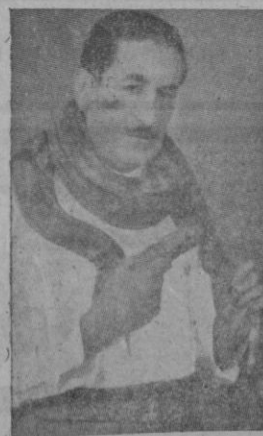
...que no cesaba de gritar: «lagarto, lagarto»

Barcelona, tierra hermosa, te admiro y te venero. Desde esa miranda que es Montjuich, las enormes chimeneas de tus industrias, envían al cielo de tu barriada del Paralelo, grandes cortinas de humo, como si fuera un borrón constante que empaña la vida cotidiana de esa Vía cosmopolita, extremadamente luminosa..., demasiado materialista.