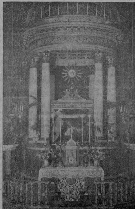
Capilla de San Alonso. Guarda en su seno el Cuerpo del Santo.