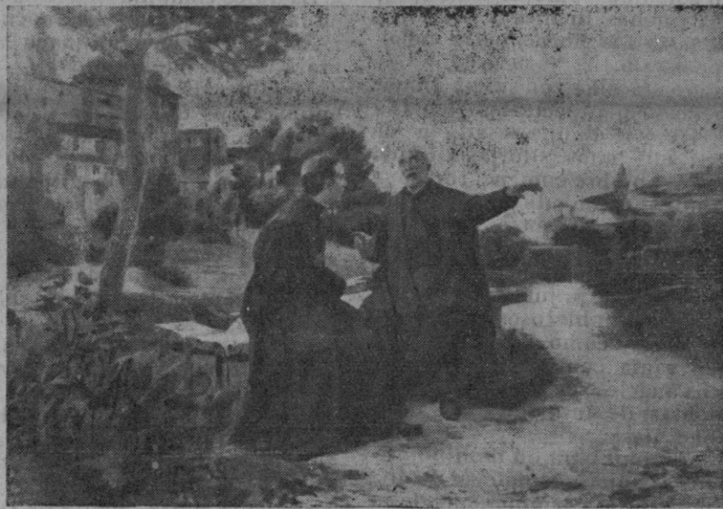
Conversación entre santos. San Alonso Rodriguez y su mejor discípulo San Pedro Claver.

En Montesión, Iglesia Claustro, Refectorio y Patios fueron testigos de la altísima virtud de Alonso y de los grandes favores que le dispensaron Jesús y su Santísima Madre — — María — —