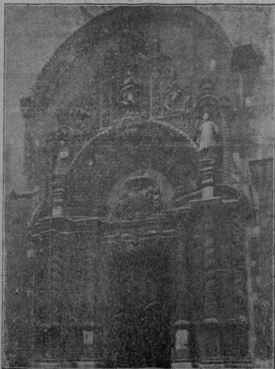
Fachada de la Iglesia de Montesión, de puro estilo ignaciano

La Capilla de las Reliquias, es una verdadera joya. Fue la última morada del santo, la que le vió morir de amor, la que contempló su subida a los cielos, en busca de su — — — Jesús. — — —