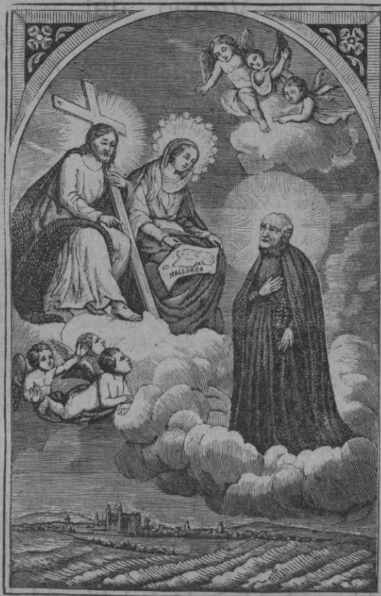
Jesús y María ponen a Mallorca bajo la protección de su siervo, Alonso.

En Montesión, Iglesia Claustro, Refectorio y Patios fueron testigos de la altísima virtud de Alonso y de los grandes favores que le dispensaron Jesús y su Santísima Madre — — María — —