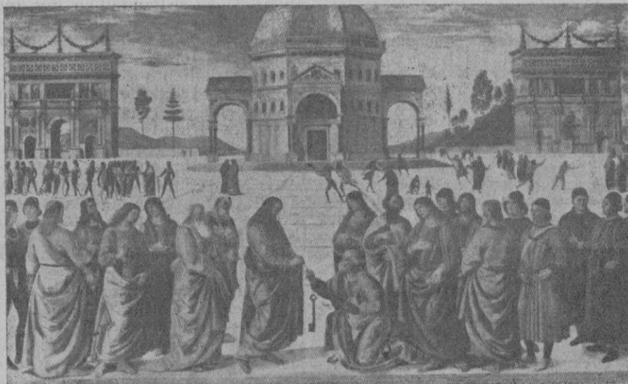
El divino Maestro entregando las llaves a Pedro. (El Perugino)

Los cetros de los Reyes y Emperadores, el bastón de mando de los grandes Generales y Conquistadores, las insignias todas de los poderes humanos, aunque respetabilísimas y augustas, no admiten el parangón con esas llaves de Pedro, poder humano-divino que no pueden otorgar los hombres. El Pontificado Romano se alza en medio del mundo y en el centro de la historia como el sostén moral de todas las Autoridades, como la fuente de todas las virtudes y el origen divino de la obediencia a la Ley, del respeto al Poder y del amor al hermano, cosas todas que ponen a la civilización cristiana por encima de todas las civilizaciones de la historia.