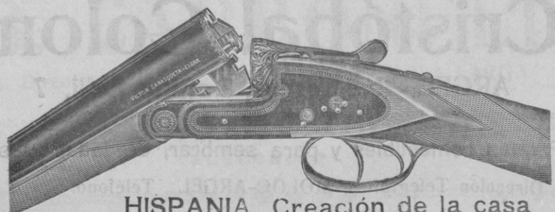
HISPANIA Creación de la casa