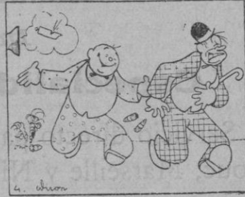
De cómo Emil se ha librado de sus visitas gorrizas e importunas.