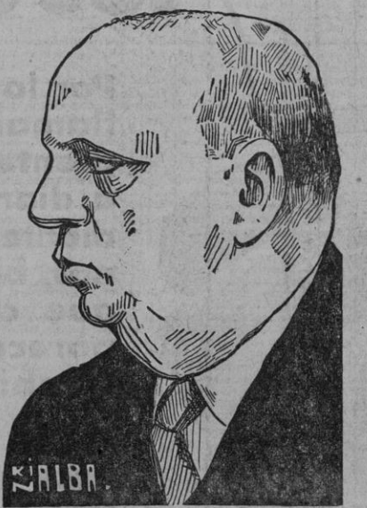
Y la intranquilidad de las clases dominantes.

La convulsión de una revolución, con un resultado ú otro, la puede soportar un país; lo que no puede soportar un país es la sangría constante del desorden público sin una finalidad revolucionaria inmediata; lo que no soporta una nación es el desgaste de su Poder público y de su propia vitalidad económica, manteniéndose el desasosiego, la zozobra y la intranquilidad. Podrán decir espíritus un poco simples que este desasosiego, esta zozobra, esta intranquilidad los padecen sólo las clases dominantes. Eso, á mi juicio, constituye un error. De ese desasosiego, de esa zozobra y de esa intranquilidad no tarda en sufrir los efectos perniciosos la propia clase trabajadora, en virtud de trastornos y de posibles colapsos de la economía, porque la economía tiene un sistema á cuya transformación aspiramos; pero que mientras subsista hemos de atenernos á sus desventajas, y entre ellas, esta: la de que refleja dolorosamente sobre los trabajadores la alarma, el desasosiego,