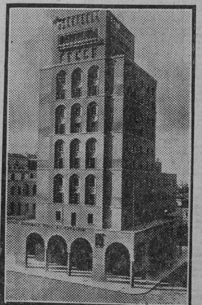
LA MODERNA ARQUITECTURA. Magnífica construcción esta del palacio del Instituto Nacional de Seguros, en Brescia, en la que se concilian las líneas y el gusto moderno con la gracia y belleza arquitectónica.

Enviado especial en Japón y Manchukuo. (Prohibida la reproducción).