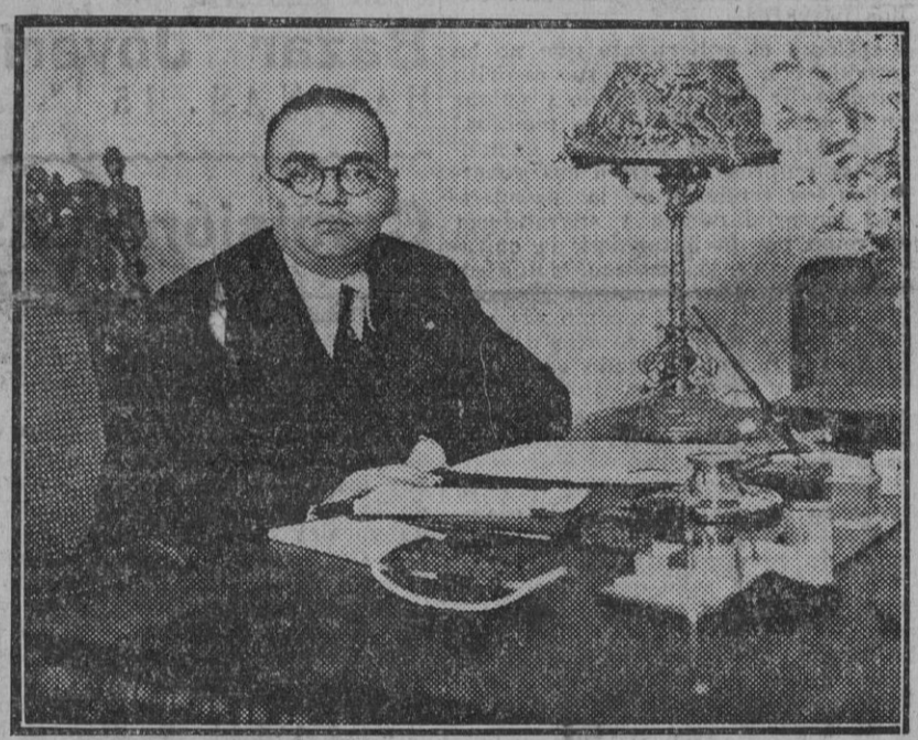
Don Horacio Hermoso Araujo, nuevo alcalde de Sevilla.

El artículo 42 del decreto de 22 de Noviembre de 1935, en armonía con el artículo 6.º de la ley de 27 de Junio de 1934, limita á CINCO MINUTOS por cada hora de programa la radiación de publicidad. El señor ministro de Obras Públicas y Comunicaciones puede obligar á las estaciones radioemisoras al cumplimiento de la ley.